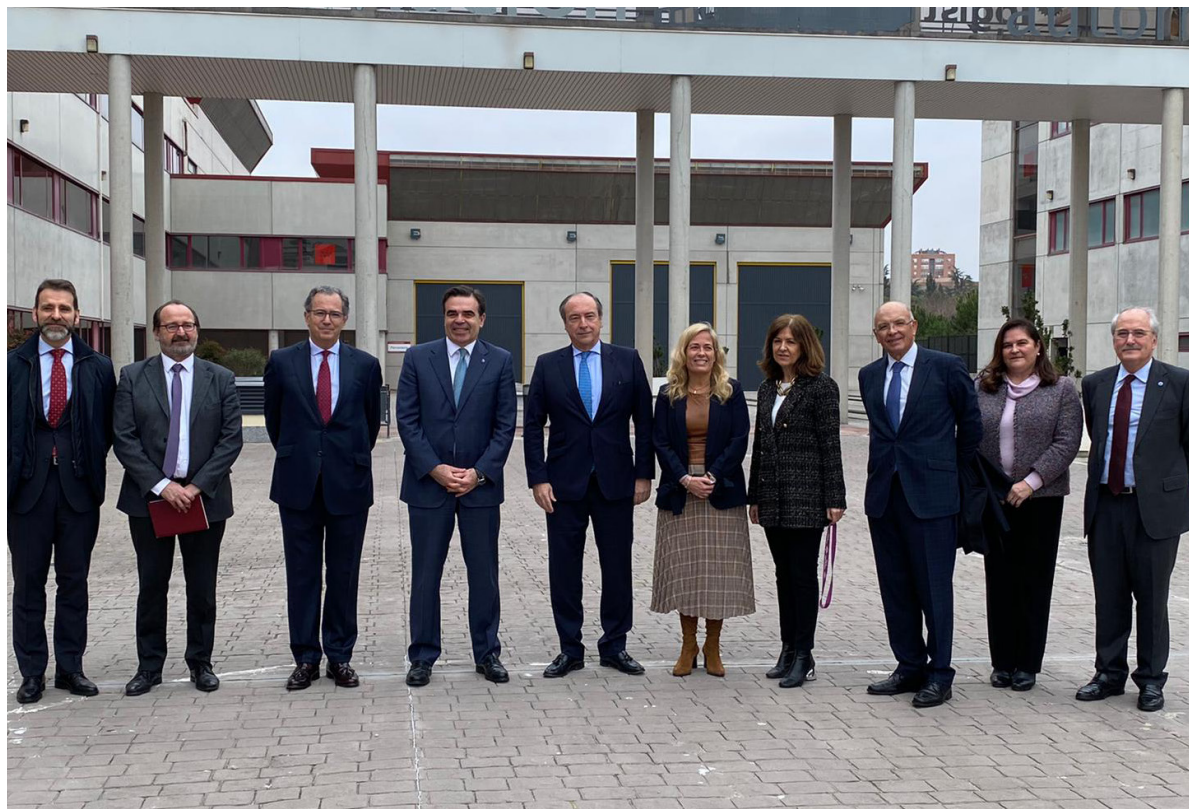
17/2/20 Visita del vicepresidente de la Comisión Europea al centro Profesor Raúl Vázquez

Asimismo, la Delegación organizó 16 reuniones de trabajo virtuales con representantes clave de las instituciones europeas al más alto nivel, abiertas a las empresas/organizaciones miembros de