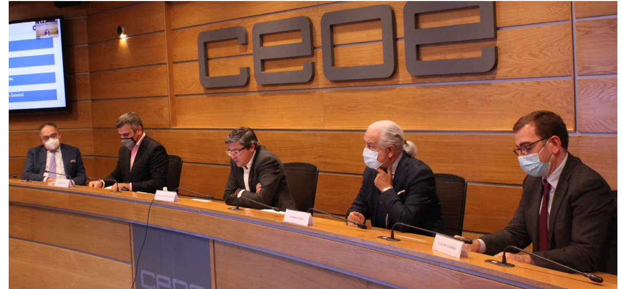
10/11/20 Comisión de Competitividad, Comercio y Consumo.

También se ha participado en la revisión de la Ley de la Ciencia. Además, se ha contado con la intervención del Ministro de Ciencia e Innovación en la reunión de la Comisión donde se presentó el Pacto por la Ciencia y la Innovación, al que se ha sumado CEOE junto con otras 75 instituciones.