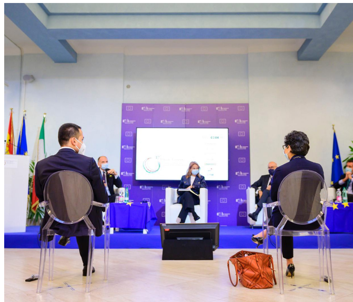
20/10/20 Foro de diálogo Italia-España