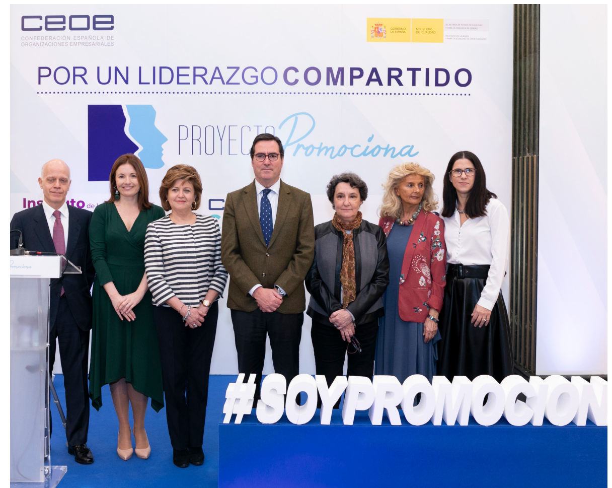
05/02/20 Proyecto Promociona