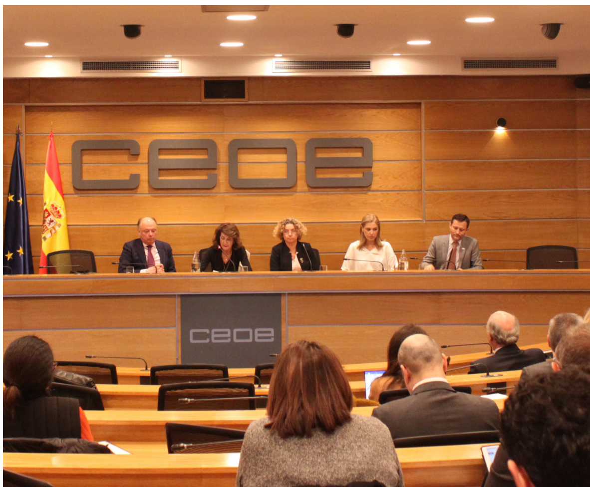
17/01/20 Comisión de Responsabilidad Social Empresarial de CEOE

Tratándose del evento informativo más relevante que acontece durante el 2020, se contabilizó la mayor aparición de CEOE y su presidente en medios de comunicación y redes sociales de todo el año.