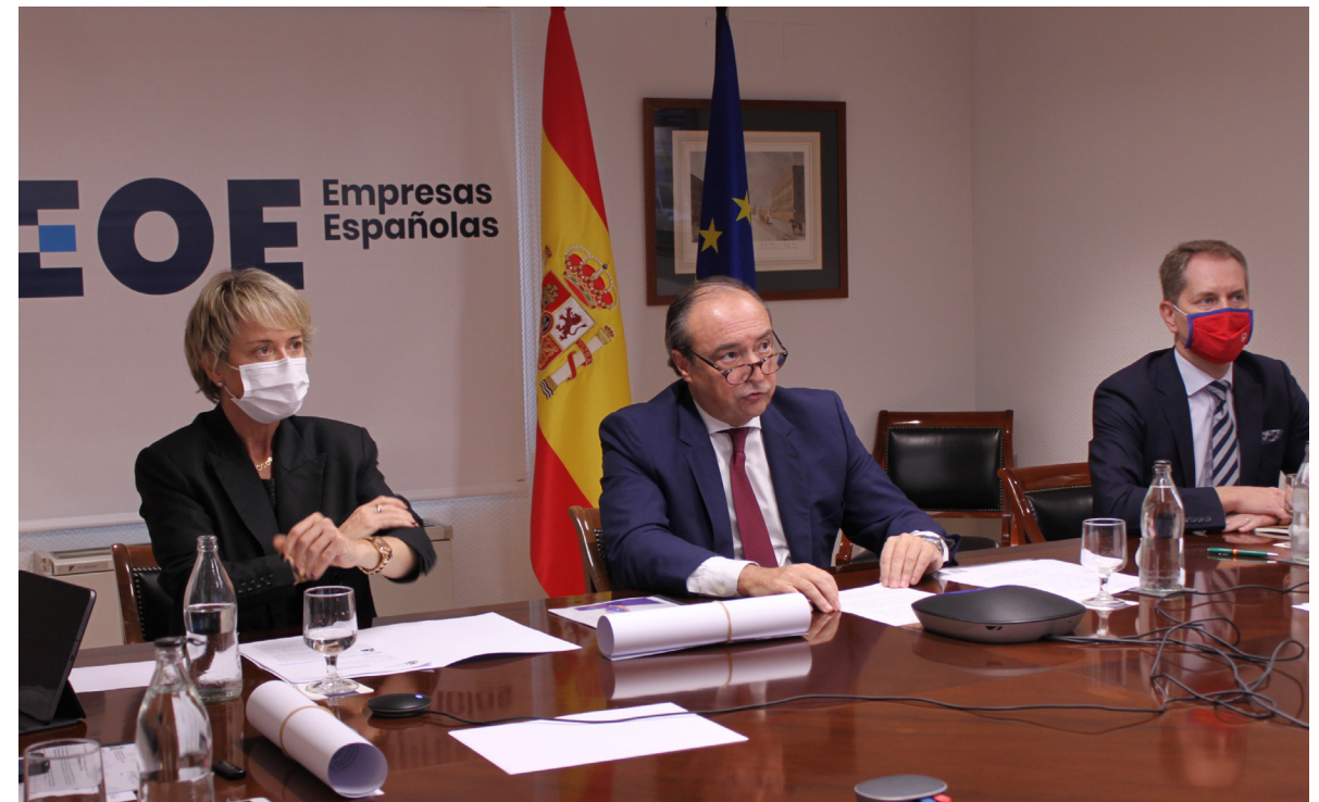
03/11/20 Presentación de la App Radar COVID con la secretaria de Estado de Digitalización e Inteligencia Artificial, Carme Artigas

nectada y Segura. En este grupo participan representantes de la Comisión de Desarrollo Sostenible y Transición Ecológica, del Consejo del Transporte y la Logística, de la Comisión de Infraestructuras y Urbanismo y de la Comisión de Concesiones.