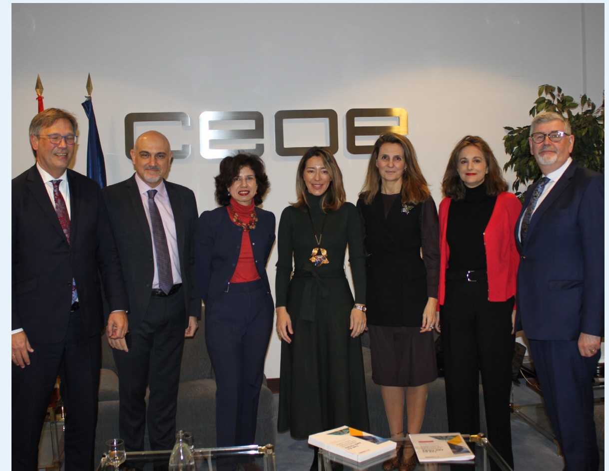
23/01/20 Encuentro con la secretaria de Estado de Comercio, Xiana Méndez, en el marco de la Comisión de Relaciones Internacionales