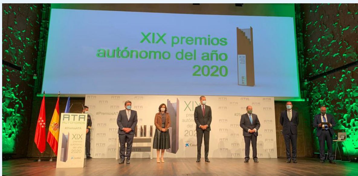
13/10/20 XIX Premios Autónomo del Año