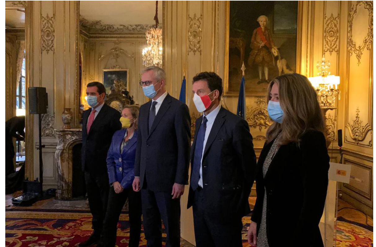
23/10/20 Visita a París junto a los ministros de Economía de España y Francia: Nadia Calviño y Bruno Le Maire