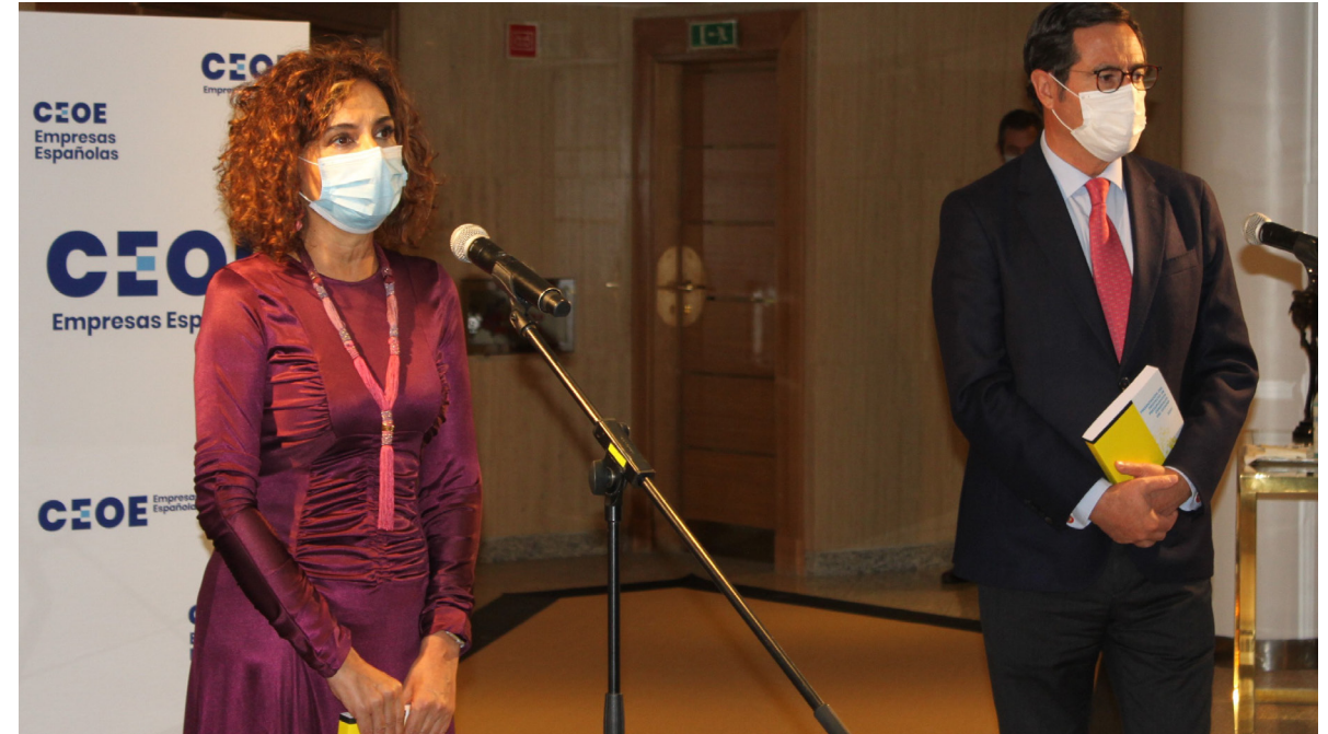
05/11/20 Visita de la ministra de Hacienda, María Jesús Montero, para presentar los Presupuestos Generales del Estado