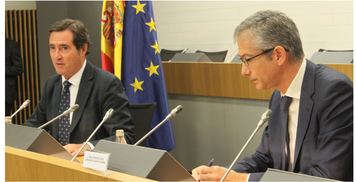
16/09/20 Visita del gobernador del Banco de España, Pablo Hernández de Cos

El Instituto de Estudios Económicos (IEE), en primer lugar, y CEOE, en quinto lugar, fueron las instituciones que más acertaron con sus previsiones la caída de la economía española en 2020