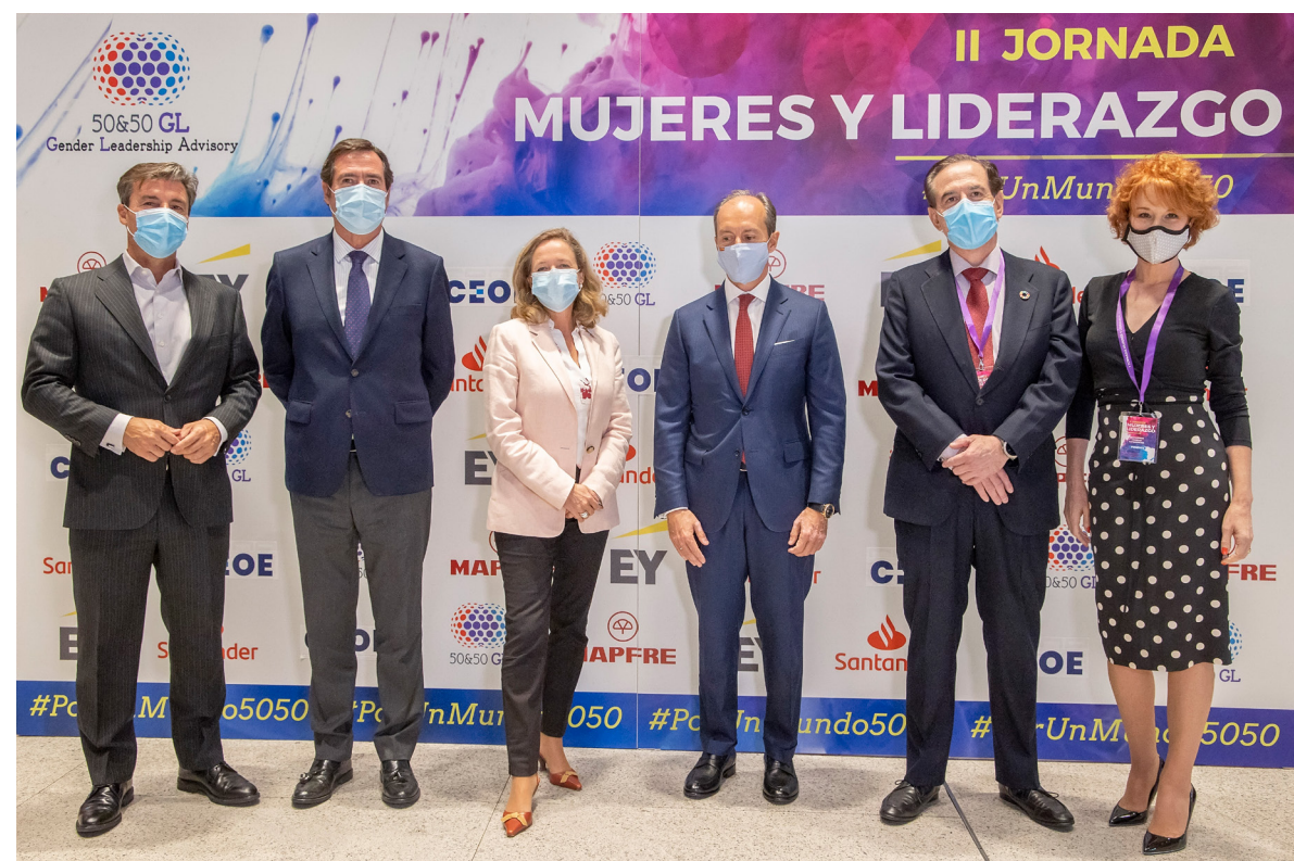
29/09/20 II Jornada Mujeres y Liderazgo organizada por la consultora 50&50 GL

Así, en el ámbito de las Relaciones Institucionales, el departamento ha participado y representado a CEOE en un amplio abanico de actos de muy distinto tipo, a lo largo del año 2020, que van desde las relaciones y presencia en foros de opinión, participaciones como jurado, moderación de actos, presencia y colaboración en la organización de jornadas, encuentros empresariales, etc.