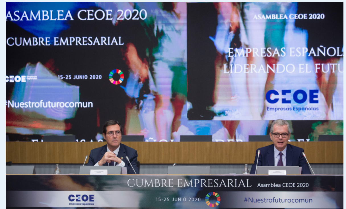
25/06/20 Cumbre empresarial 'Empresas españolas liderando el futuro'