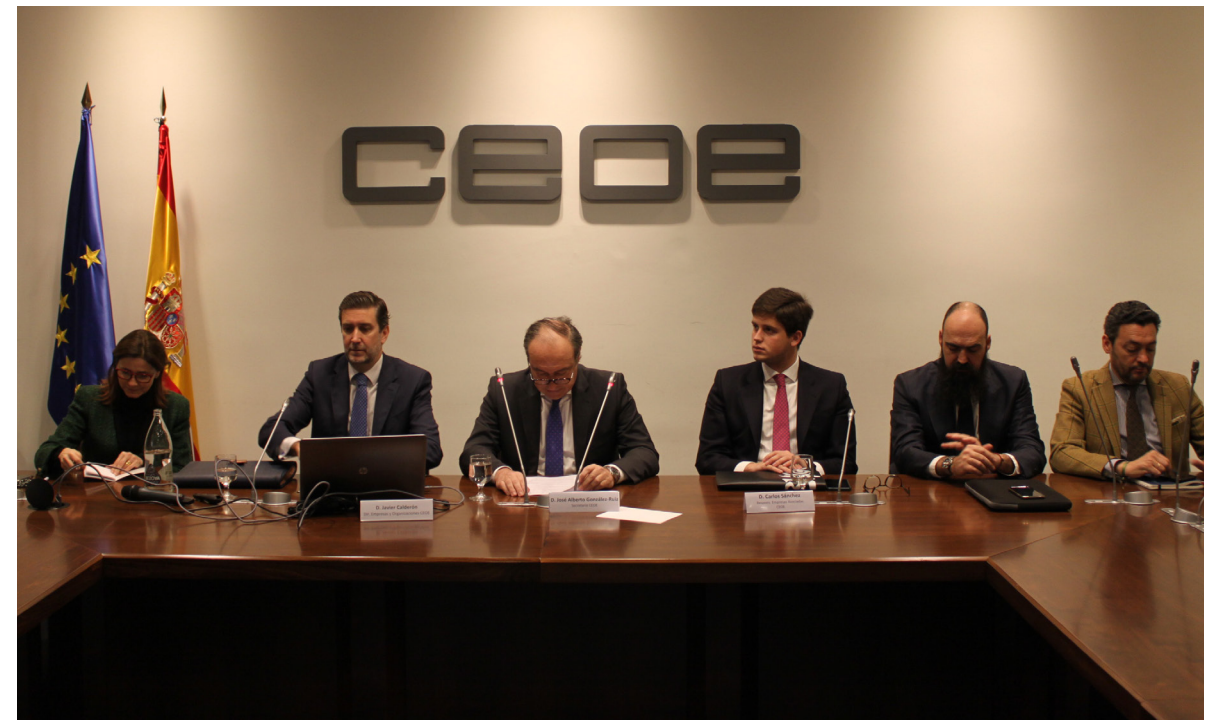
02/03/20 Presentación CEOENet

Con objeto de reflexionar sobre el futuro de las organizaciones empresariales en el ámbito de la captación y fidelización de socios, se mantuvo un encuentro con miembros de organizaciones sectoriales y territoriales de CEOE. Durante esta reunión, las organizaciones resaltaron el importante papel de las mismas durante la gestión de la pandemia.