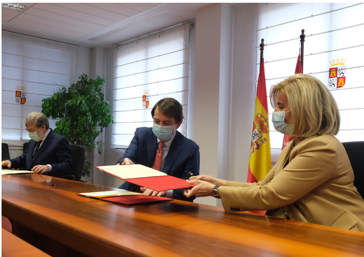
18/01/21 Adhesión de Castilla y León al Plan Sumamos. Firma entre la presidenta de la Fundación CEOE, el presidente de la Junta de Castilla y León y el presidente de CEOE Castilla y León

reforzar el talento y los liderazgos femeninos, participando en las reuniones de sus órganos de gobierno. Junto al crecimiento del Proyecto Ceo's por la Diversidad con el lanzamiento en el mes de julio de la segunda edición y el crecimiento con nuevas empresas hasta llegar a 75 (se ha participado en todas sus acciones, sesiones y encuentros junto a la Fundación Adecco), se ha participado en una nueva edición del Programa Jóvenes y Liderazgo del Proyecto Chicas Imparables, con 50&50 GL , cuyas Jornadas Mujeres y Liderazgo se celebraron, en su tercera edición, en CEOE el pasado mes de septiembre, y se lanza la II Edición del Programa Radia tras el éxito del primero, en el mes de octubre, como apuesta por una sociedad digital inclusiva, igualitaria e innovadora,