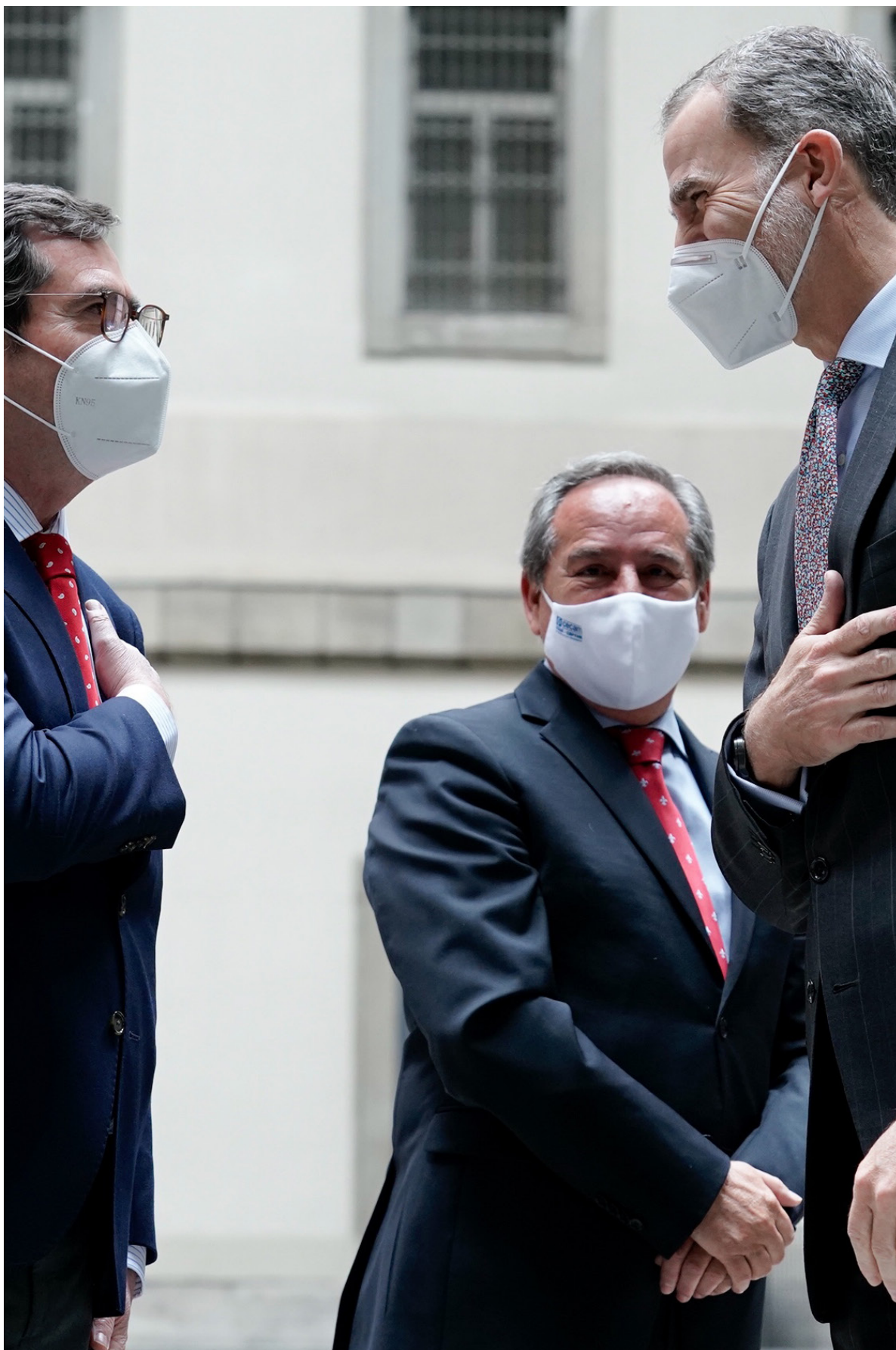
08/4/21 Premios CEPYME 2020