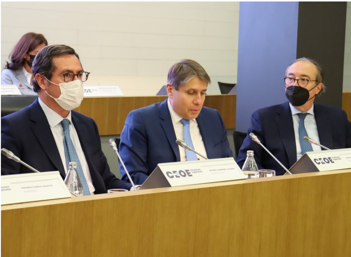
17/11/21 Participación del director general de BusinessEurope en la Junta Directiva de CEOE de noviembre