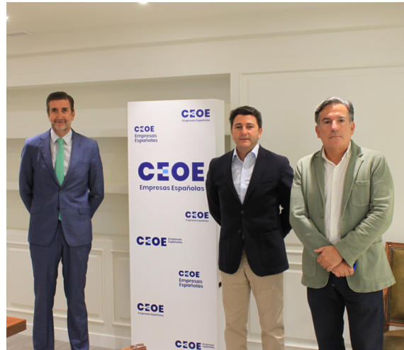
09/09/21 Visita a CEOE de la organización AEMAR