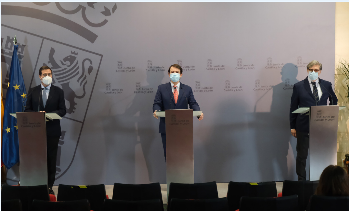
18/01/21 Adhesión al Plan Sumamos de Castilla y León