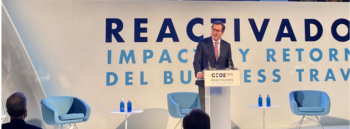
29/09/21 El presidente de CEOE inauguró el evento 'Reactivados: Impacto y retorno del Business Travel' en la sede de La Bolsa de Madrid

relacionados con la circularidad y el turismo.