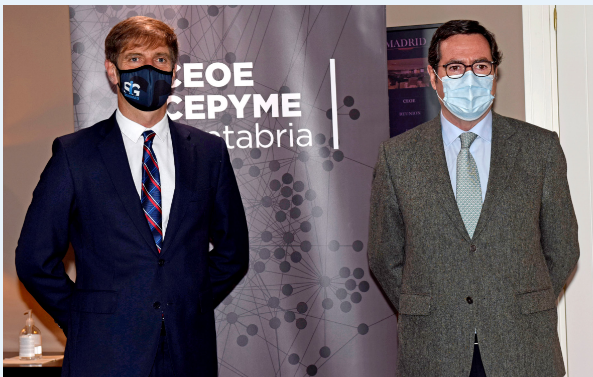
17/05/21 Visita del presidente de CEOE a CEOE CEPYME Cantabria