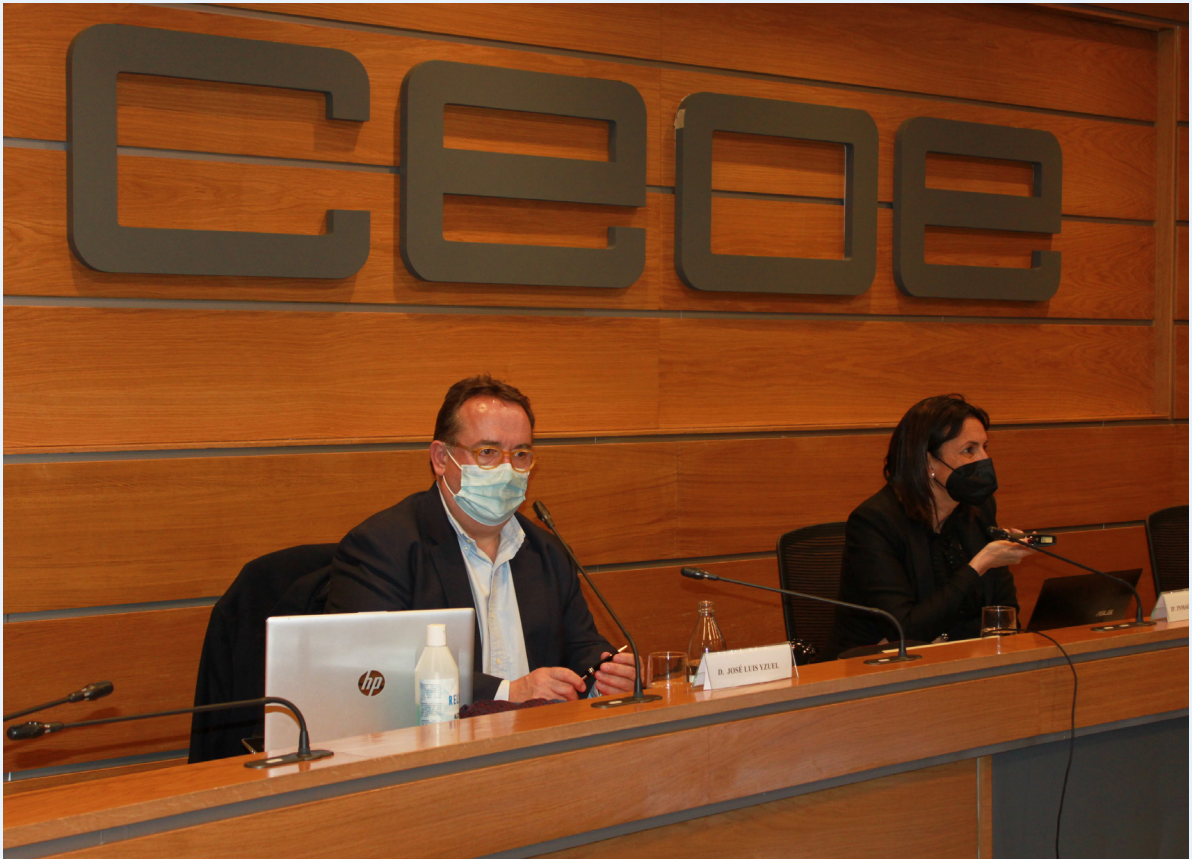
23/02/21 Pleno del Consejo de Turismo de CEOE

mulación estratégica al que se enfrenta el sector del turismo, así como para forjar un liderazgo en el seno del sistema turístico español que, de forma participada y transversal, derive en el despliegue de nuevos recursos y acciones orientados a la mejora de la competitividad del sector turístico.