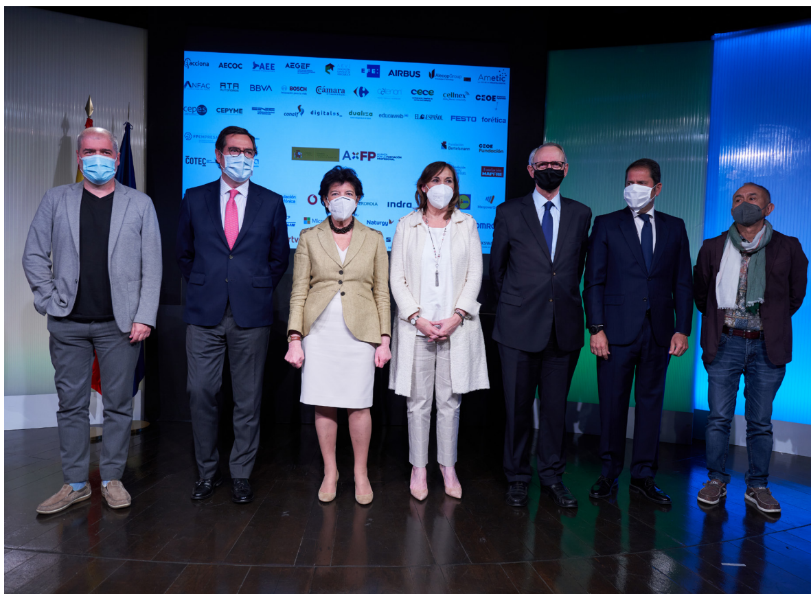
24/05/21 Acto de presentación de la Alianza por la Formación Profesional