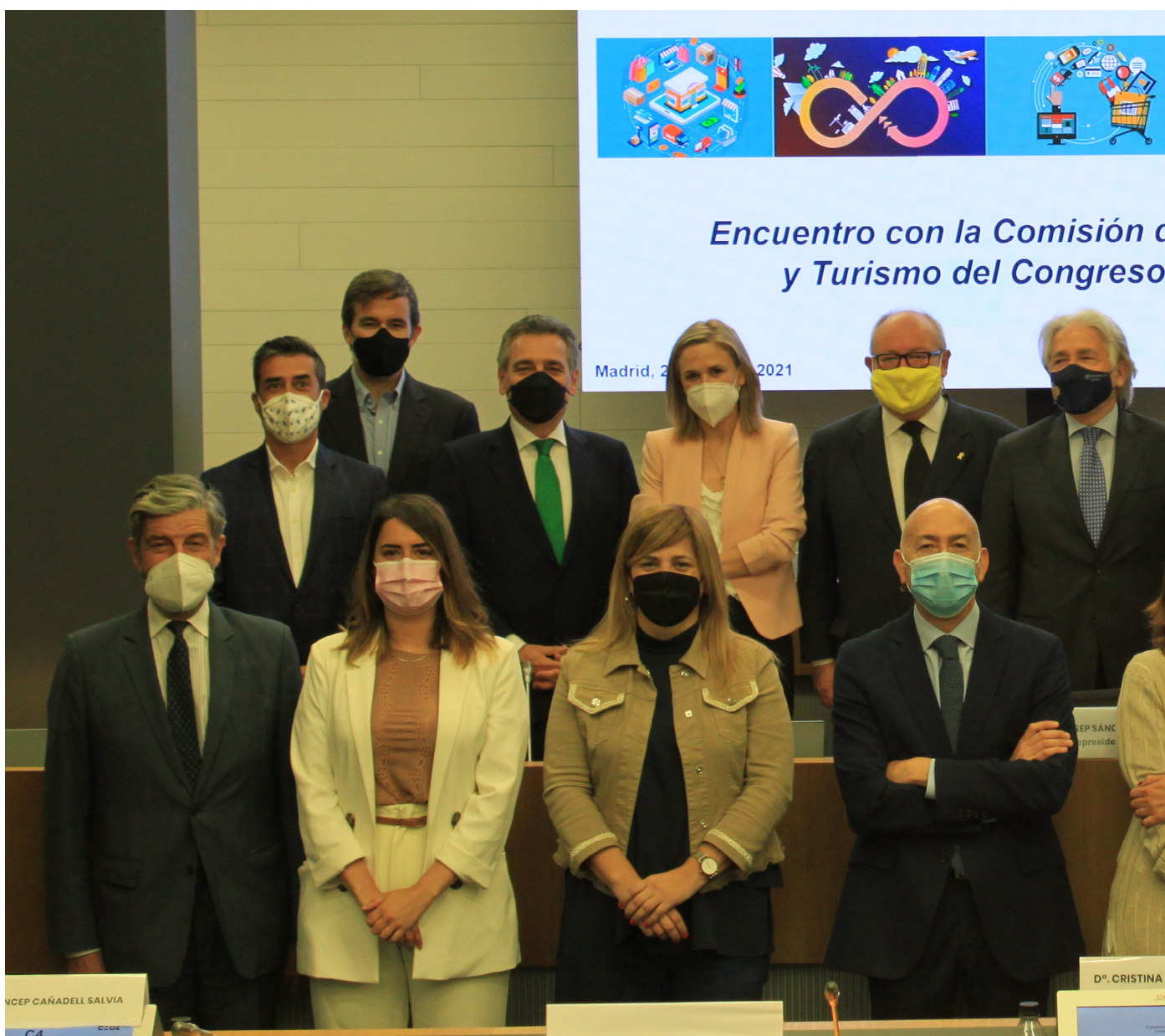
25/05/21 Encuentro de la Comisión de Competitividad, Comercio y Consumo de CEOE (C4) con la Comisión de Industria, Comercio y Turismo del Congreso de los Diputados

En cuanto a la producción de documentos se refiere, la labor de esta Comisión ha sido intensa. Entre ellos, cabe destacar el informe de 'Nuevos Costes Soportados por el Sector Comercial en España', que cuantifica los principales costes recientemente implantados en el sector comercial, o el segundo documento de consenso elaborado por la C4 en materia de regulación de las 'Áreas de Promoción de Iniciativas Económicas', creando, además, una 'Guía de APIEs para el Grupo de Trabajo de