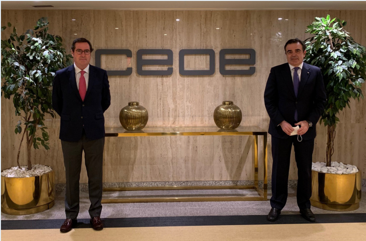
30/03/21 Visita del vicepresidente de la Comisión europea, Margaritis Schinas