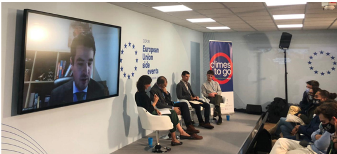
02/11/21 Jornada en el Pabellón de la UE de la COP26 'Transforming climate solutions for business, cities and civil society in Europe & Latin America'

renovable, infraestructuras eléctricas, hidrógeno renovable y estrategia de transición justa.