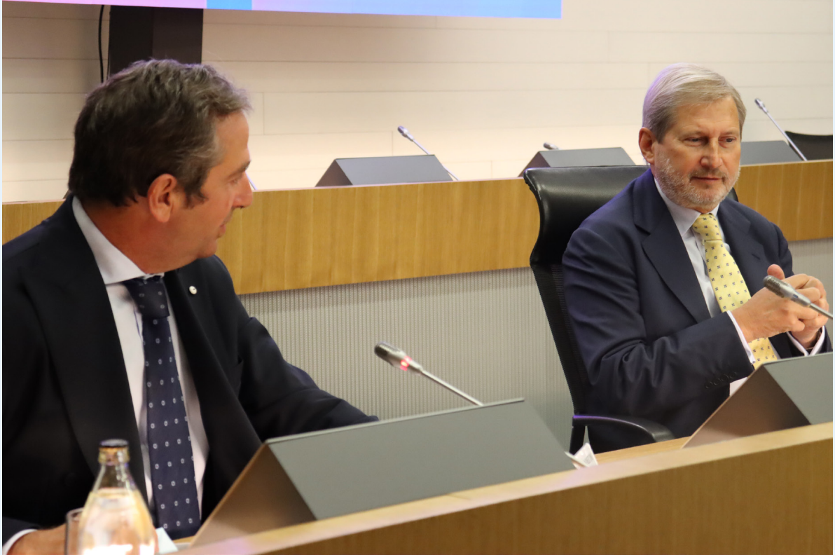
21/09/21 Visita a CEOE del comisario europeo de Presupuesto y Administración, Johannes Hahn

Administración y las empresas para analizar la evolución durante los primeros meses de entrada en vigor del Acuerdo de Cooperación y Comercio UE-Reino Unido.