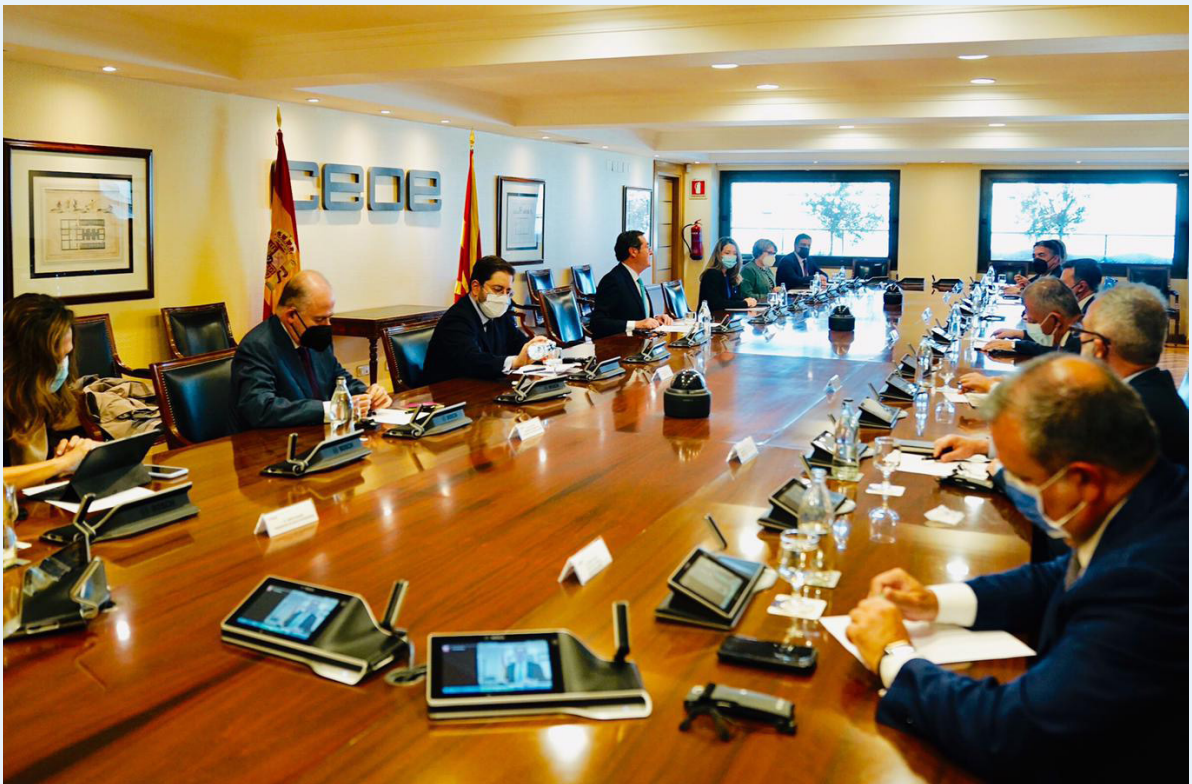
12/05/21 Encuentro con el presidente de Macedonia del Norte, Stevo Pendarovski