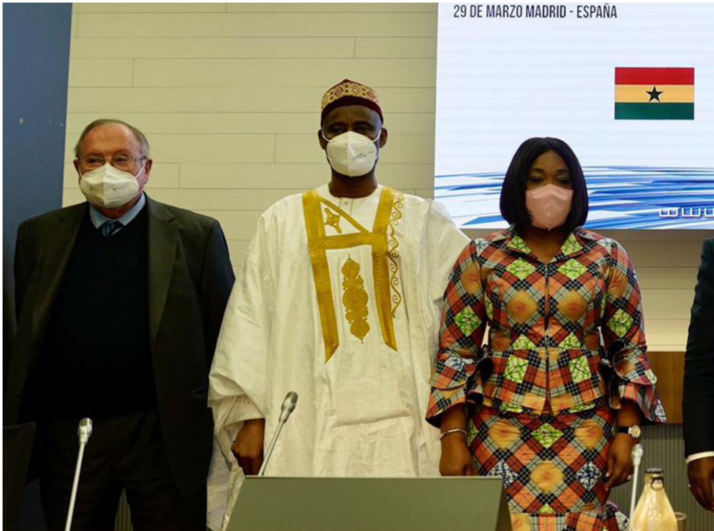
29/03/21 Encuentro empresarial España-Ghana

asistencia técnica. También cabe poner en valor la participación en el grupo de trabajo de Agenda 2030, en el subgrupo de coherencia de políticas de desarrollo con un primer insumo: "Informe de contribución del Consejo de cooperación a la Estrategia de Desarrollo Sostenible" y un próximo borrador de propuestas de coherencia de políticas de desarrollo y cooperación en el horizonte de 2022.