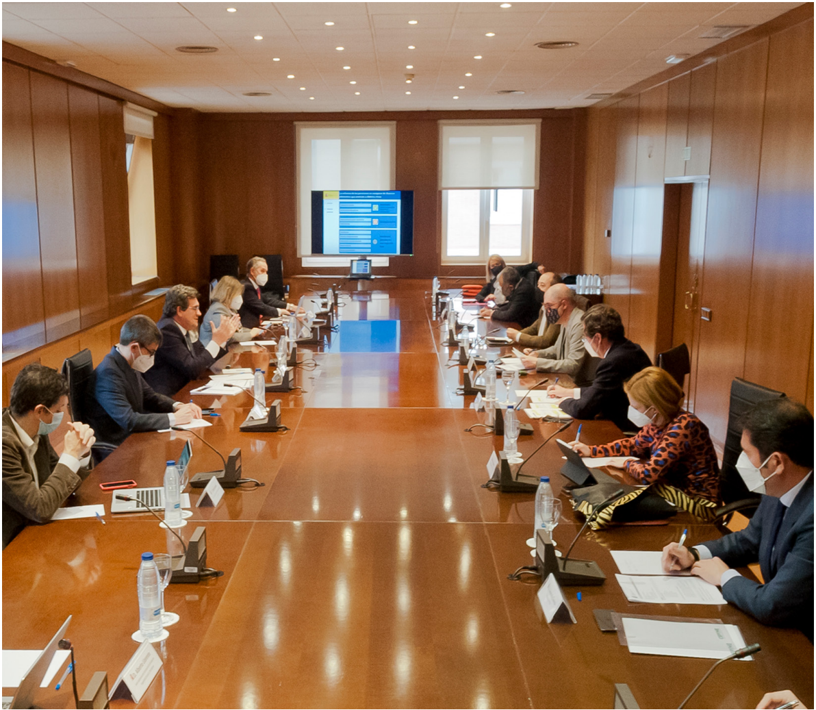
17/02/21 Mesa del diálogo social junto al ministro de Inclusión, Seguridad Social y Migraciones, José Luis Escrivá

seguro y el Grupo de Trabajo de los planes de pensiones , con el fin de configurar posición para las negociaciones con Gobierno y sindicatos sobre las respectivas materias.