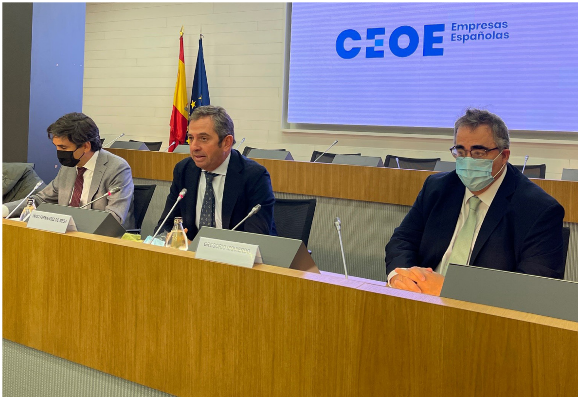
22/11/21 Pleno de la Comisión de Economía de CEOE

El Servicio de Estudios ha realizado una intensa labor en defensa de los posicionamientos empresariales en materia económica ante organismos nacionales, europeos e internacionales