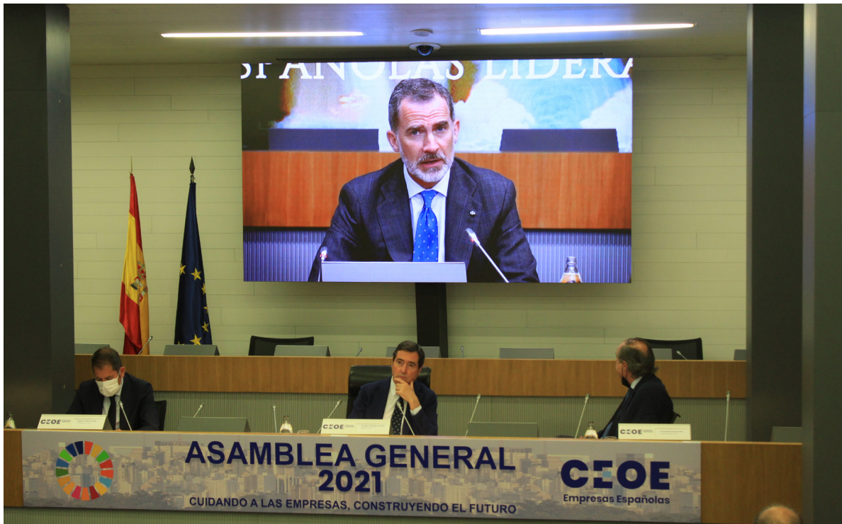
Asamblea General de CEOE en 2021

detección del coronavirus como en el proceso de vacunación, que podemos decir que fue un éxito en España.