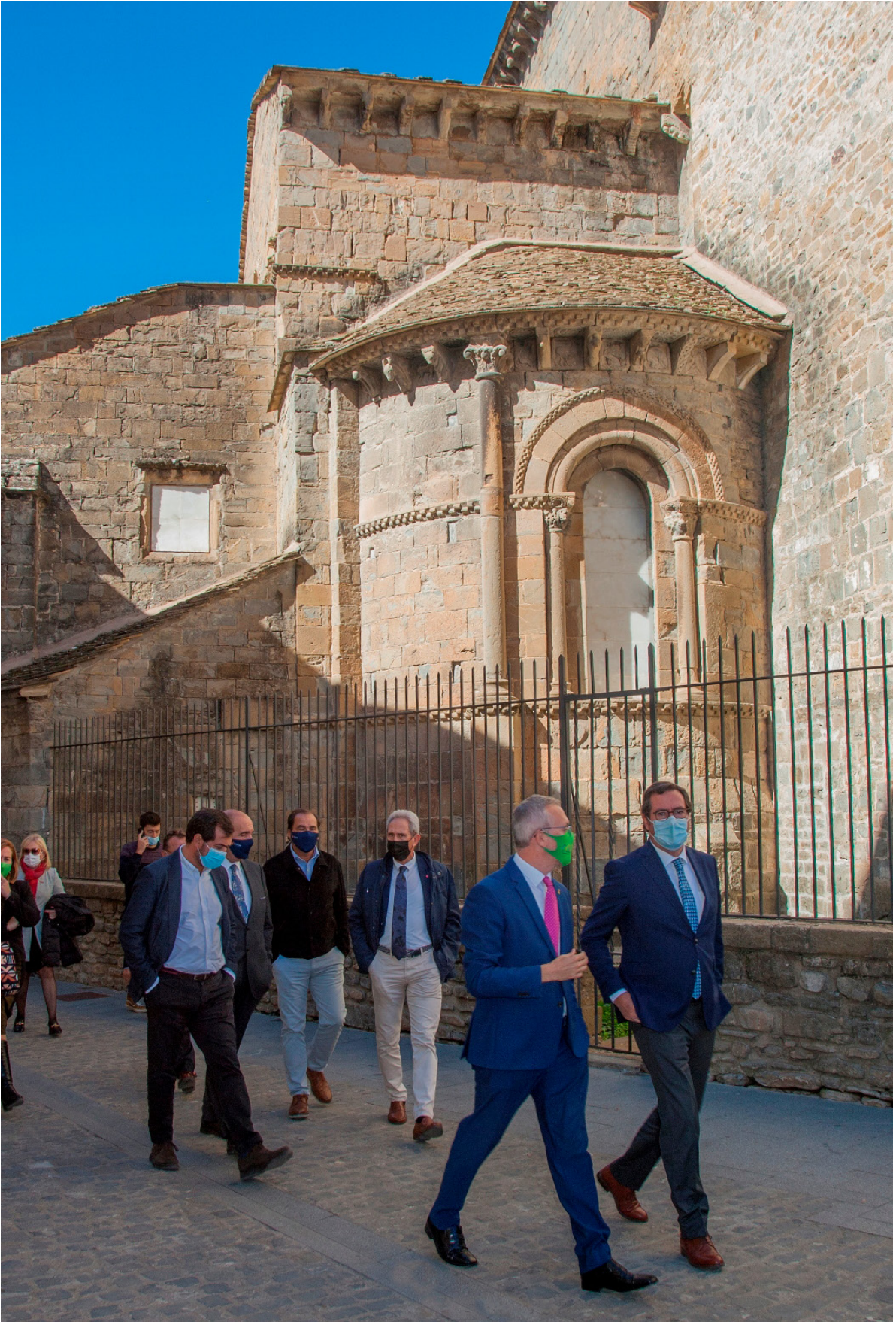
8/10/21 El presidente de CEOE en una de las paradas de 'El Camino de las Empresas' (Santo Domingo de la Calzada, La Rioja)