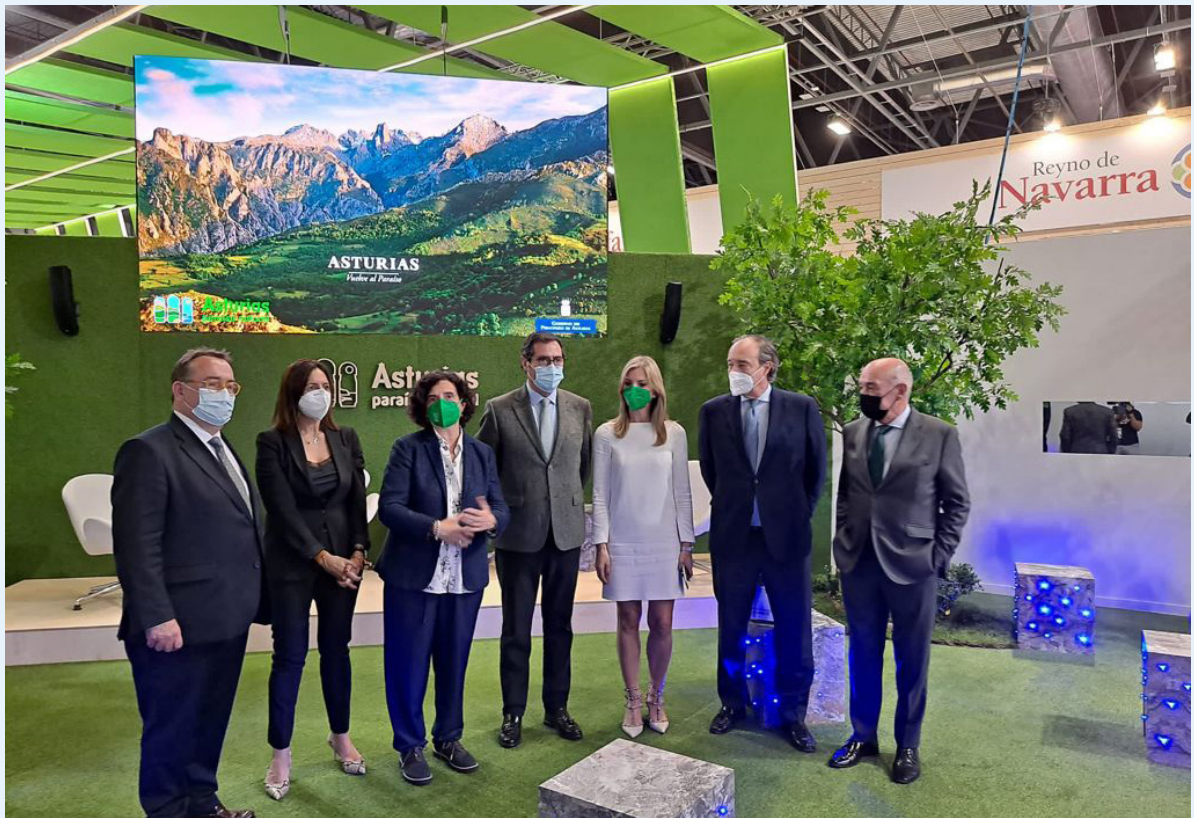
19/05/21 Visita del presidente de CEOE a Fitur