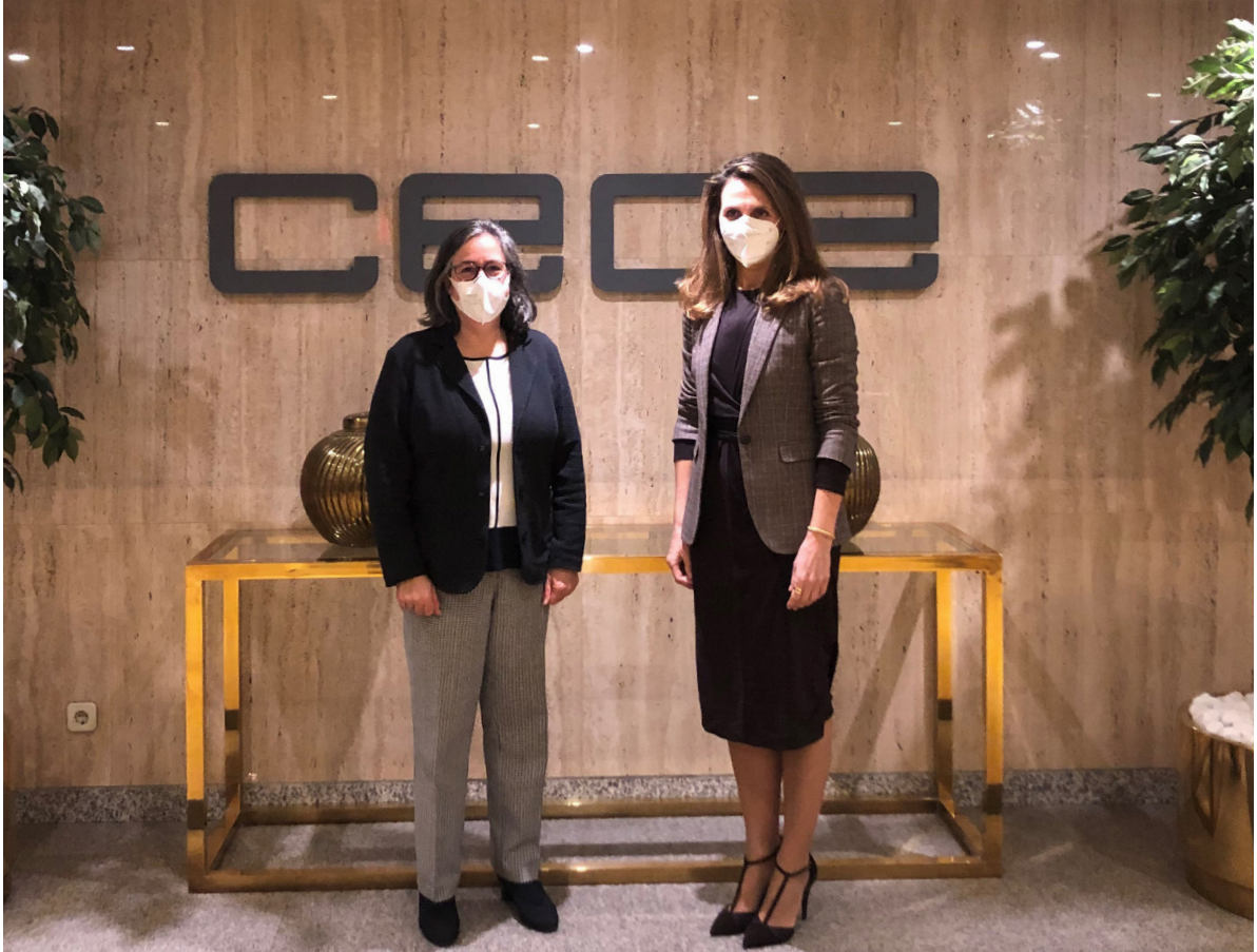
01/03/21 Encuentro con la embajadora de Canadá en España, Wendy Drukier

En esta línea de participación en organismos empresariales internacionales, también se quiere subrayar una creciente