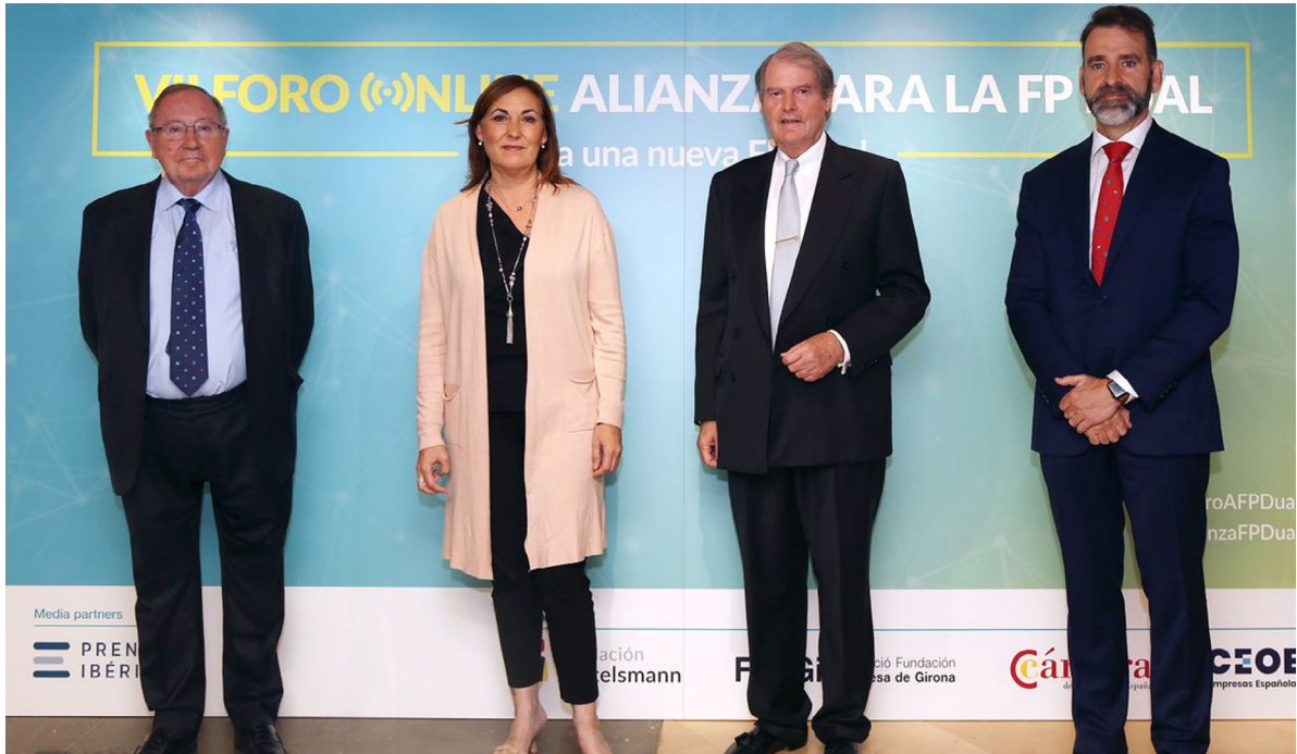
26/10/21 VII Foro Alianza para la FP Dual

encargada de la gestión y asesoramiento sobre todas aquellas materias en las que la FUNDAE es competente. Además, hay que tener en cuenta que este año ha visto incrementado notablemente su trabajo, por una parte, al ser España el país anfitrión para la celebración de la 45ª re-