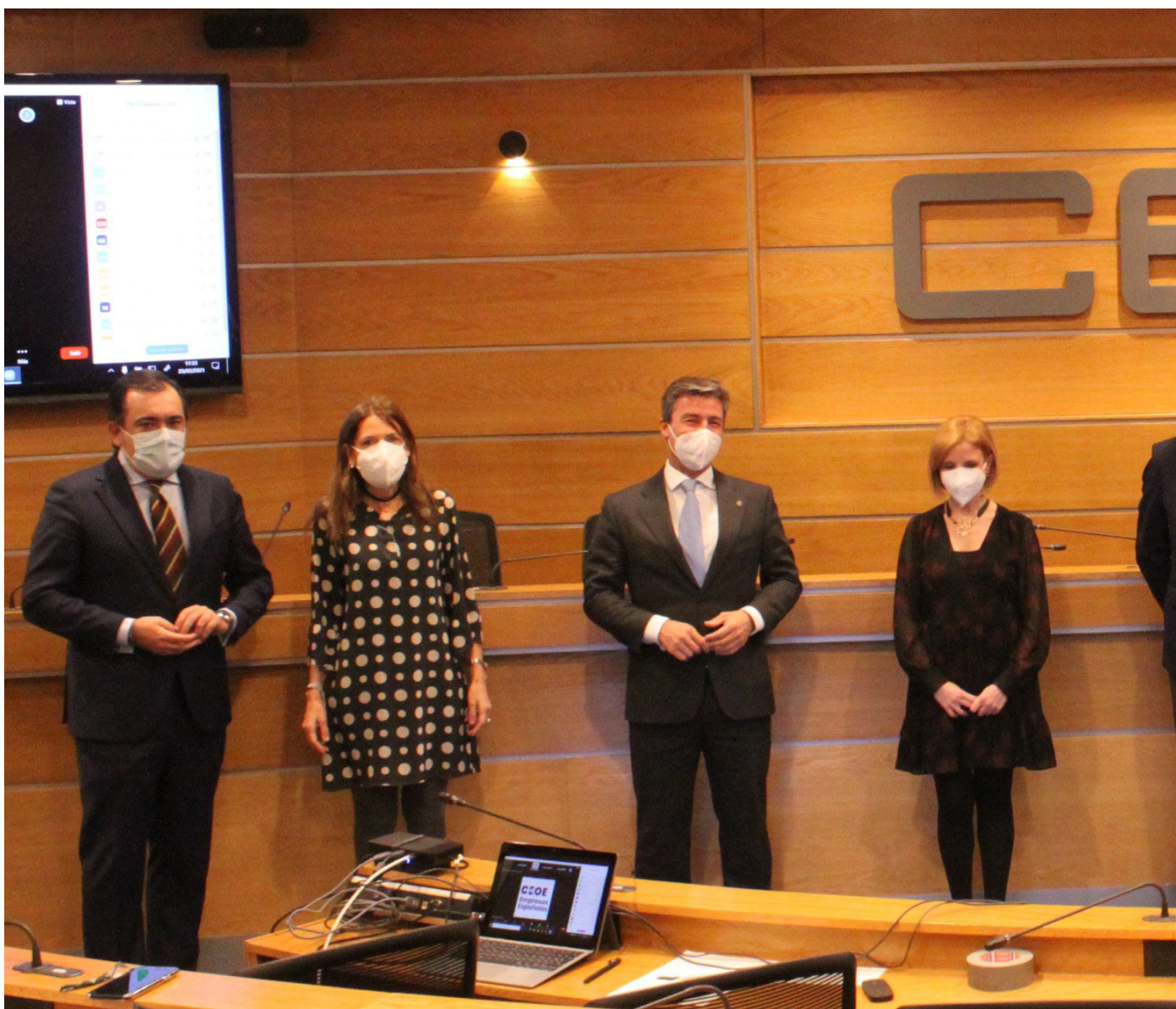
23/02/21 Acto del programa CEOs Por la Diversidad de la Fundación CEOE junto a la Fundación Adecco

loración de la acción social de los empresarios españoles.