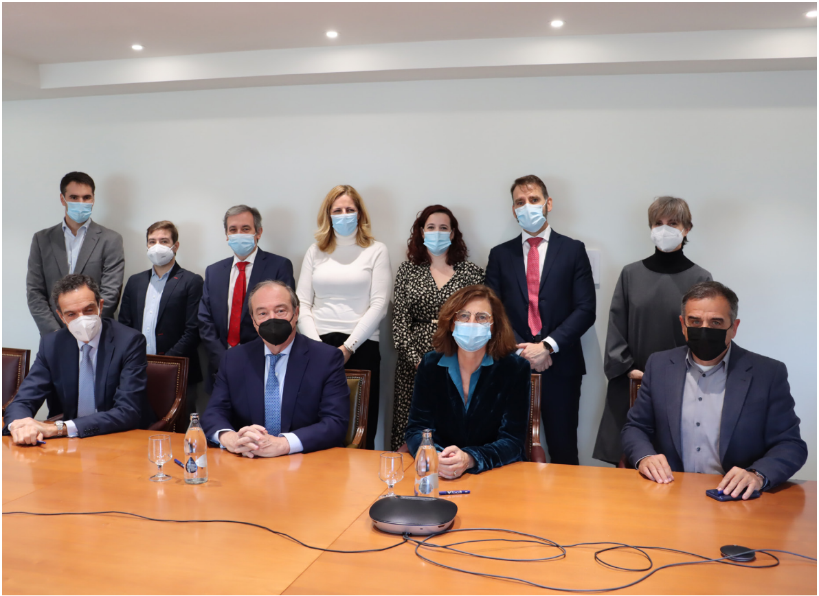
13/12/21 Firma del acuerdo del 'Nanogrado de transporte' con Fundación Telefónica, ASTIC y CONFEBUS