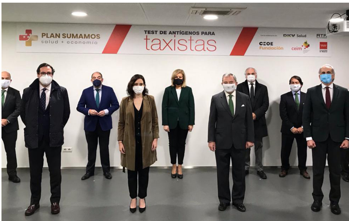
02/03/21 Inauguración del centro de testeo para los taxistas de Madrid en el marco del 'Plan Sumamos Salud + Economía'