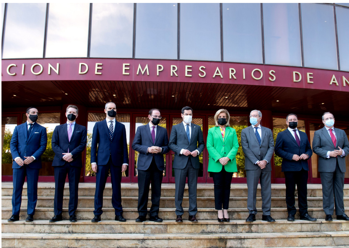
25/11/21 Celebración del primer encuentro del sector comercio en España en la sede de los empresarios andaluces, en Sevilla