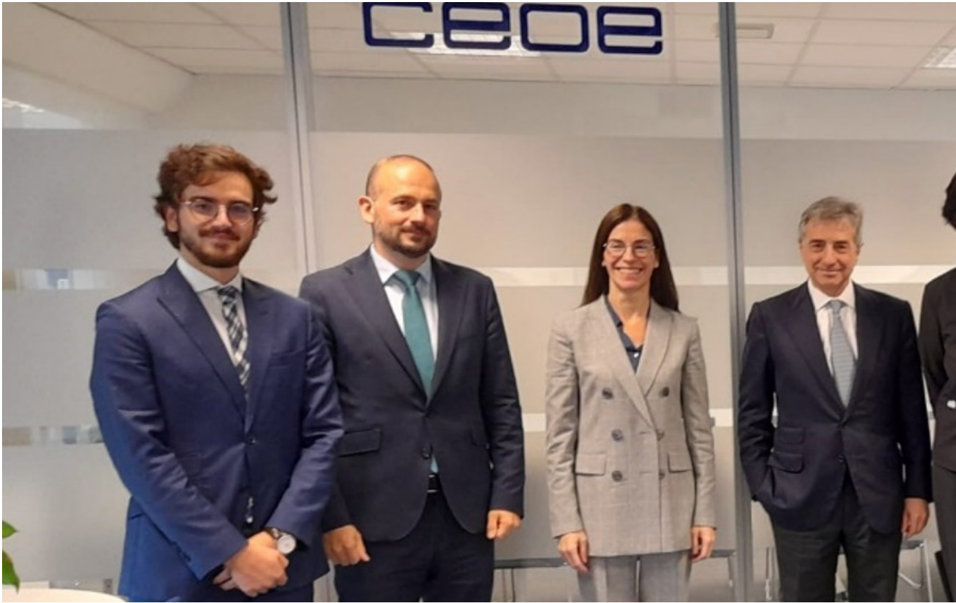
18/10/21 Reunión de trabajo con el embajador representante permanente adjunto de España ante la UE y miembros de CEOE activos en Bruselas

total de 20 encuentros con representantes de las instituciones europeas al más alto nivel, abiertos a las empresas y organizaciones miembros de CEOE más activas en Bruselas. Por ejemplo, la Delegación mantuvo una interlocución privilegiada con la Representación Permanente de España ante la UE, contando en diversas ocasiones con la participación de sus embajadores y de varios de sus consejeros. Asimismo, se contó con la intervención de eurodiputados españoles miembros de comisiones parlamentarias claves por su impacto empresarial; y de directores de la Comisión Europea en áreas sobre Mercado Interior, Industria, Emprendimiento y Pyme, Transformación Digital, Competencia, o del Servicio Europeo de Acción Exterior.