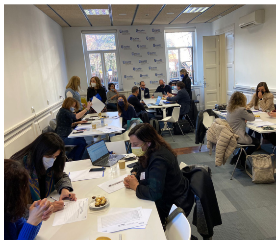
Sesión de dinámica de trabajo grupal de HR4HR Ecosystem

en este ámbito a toda la cadena de valor acelerando la transformación, y aportar a los participantes una visión sistémica sobre cómo la sostenibilidad se puede traducir en resultados económicos, ambientales y sociales tangibles.