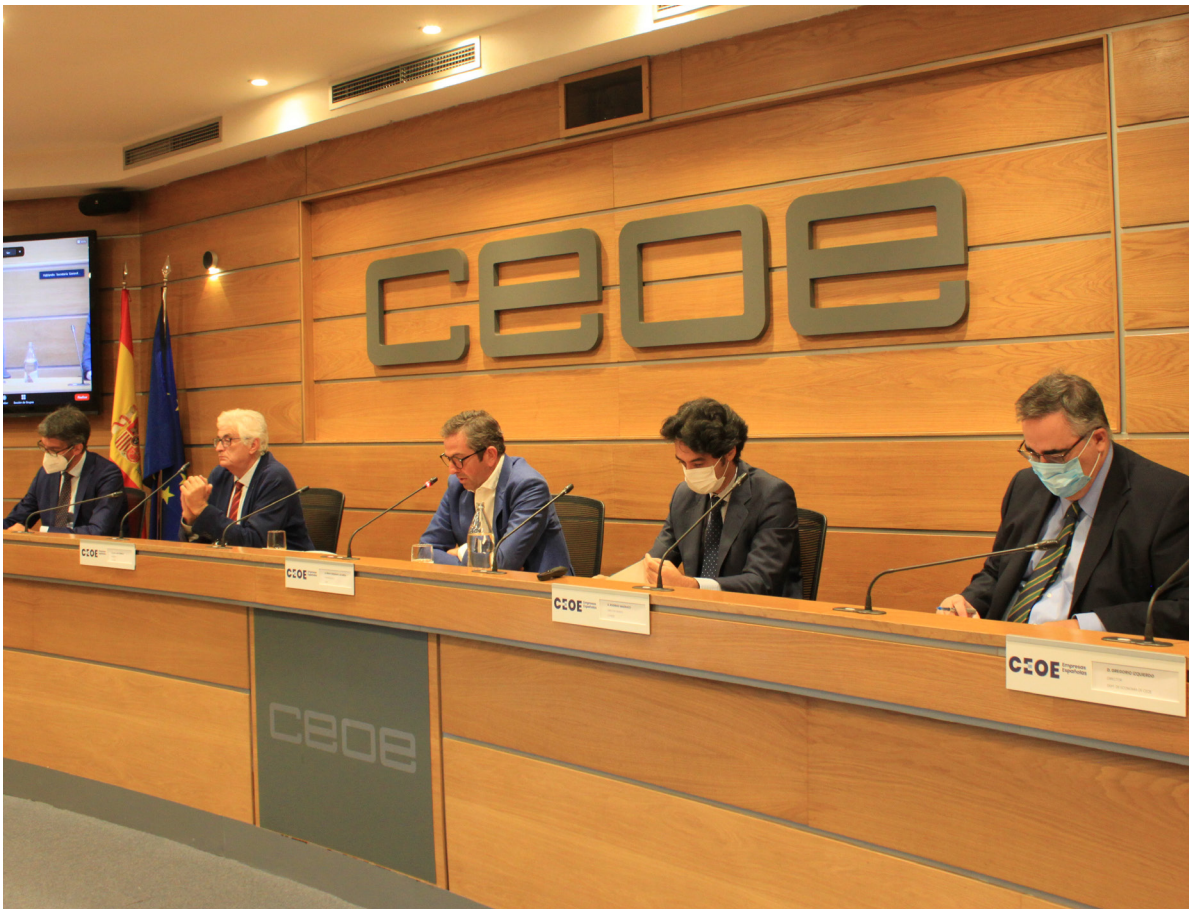
12/07/21 Pleno de la Comisión de Economía de CEOE