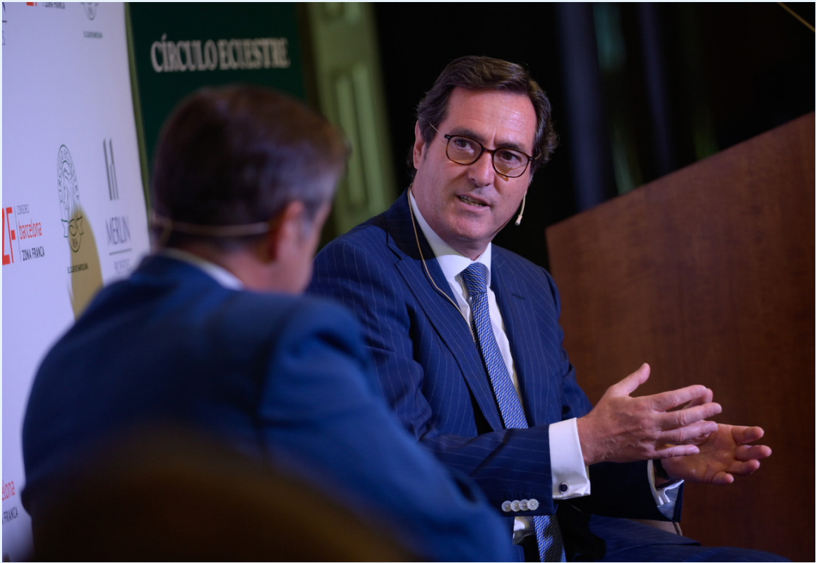
7/06/21 Foro 'Agendas Cruzadas MAD-BCN' en el Círculo Ecuestre de Barcelona