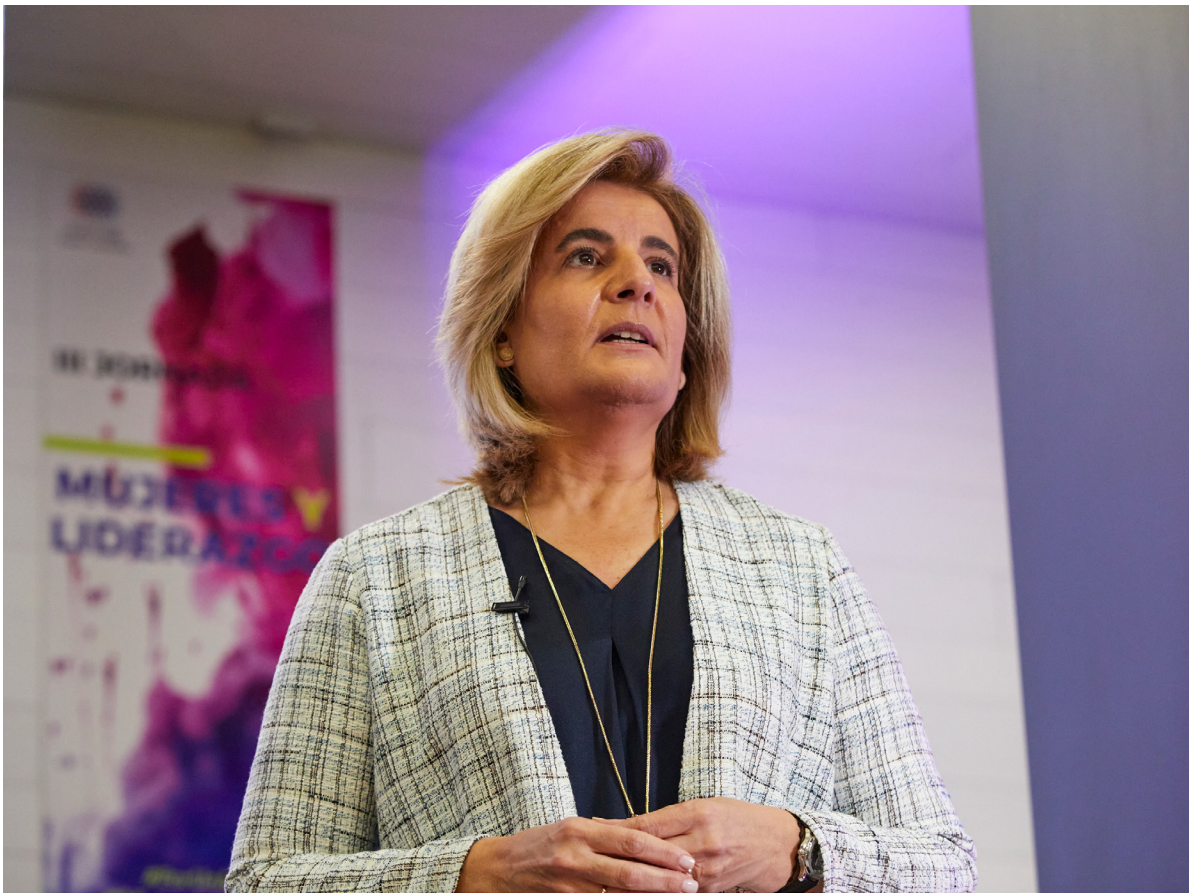
28/09/21 Participación de la presidenta de la Fundación CEOE, Fátima Báñez, en la jornada 'Mujeres y Liderazgo' de la consultora 50&50

junto a Fundación ONCE, la Conferencia de Consejos Sociales de las Universidades Españolas e Indra.