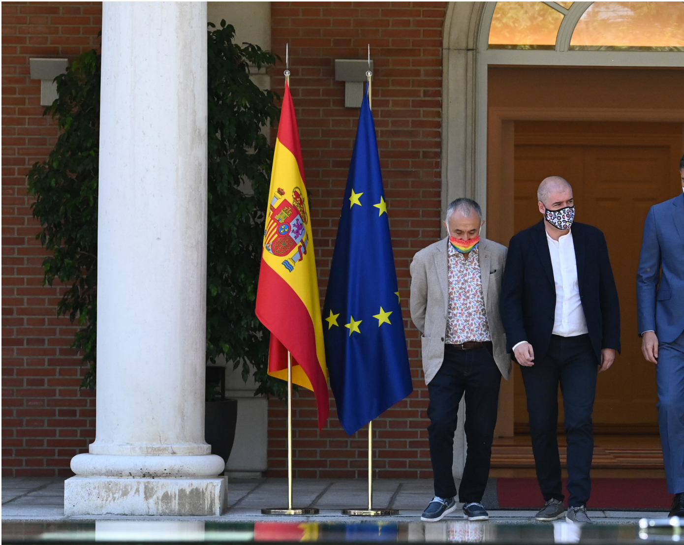
01/07/21 Firma del acuerdo para la reforma de las pensiones