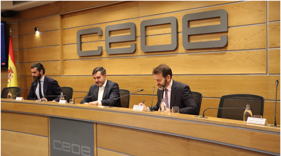
25/10/21 Curso de Liderazgo Público de CEOE Campus