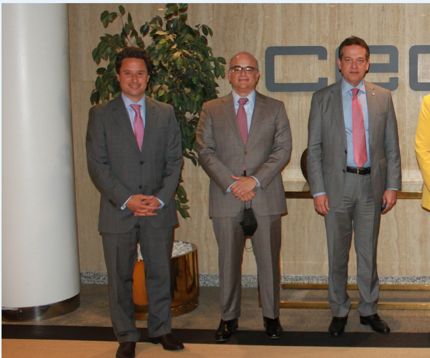
19/05/21 Visita a la sede de CEOE de autoridades de República Dominicana