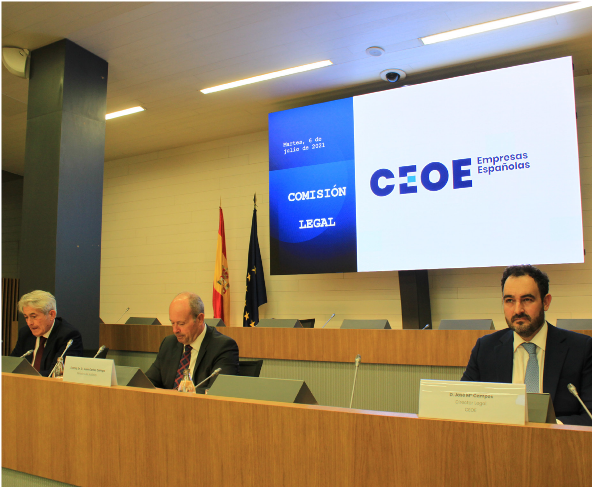
06/07/21 Visita del exministro de Justicia, Juan Carlos Campo, a CEOE

la Abogacía Española han explicado los principales proyectos y novedades jurídicas en el ámbito mercantil y empresarial.