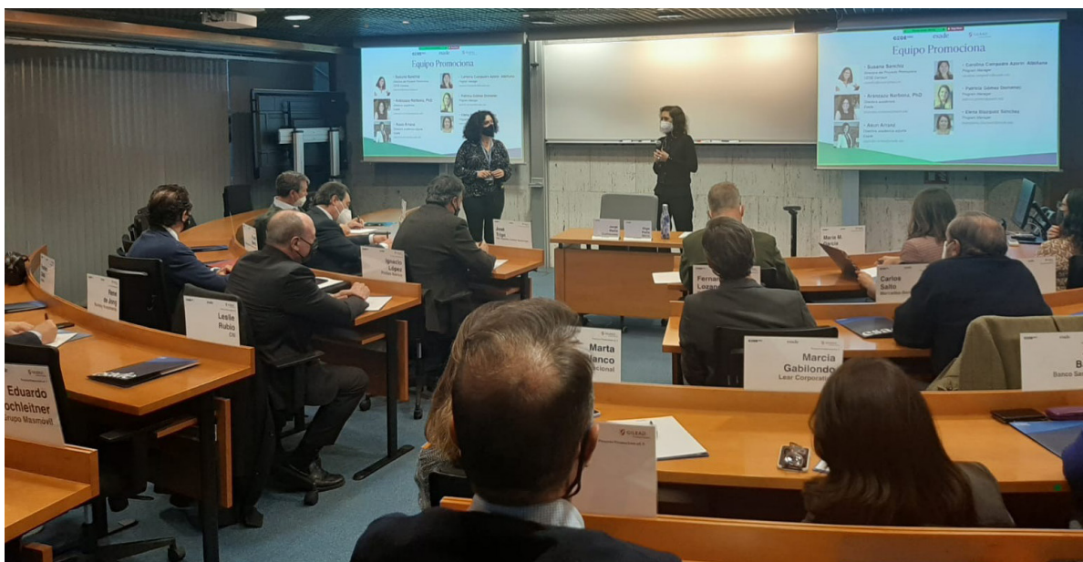
Formación de mentores/as del Proyecto Promociona