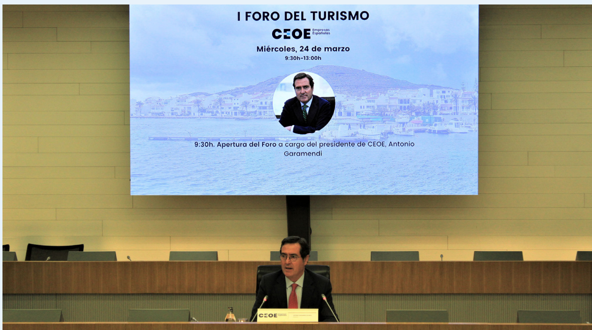
24/03/21 El presidente de CEOE inaugura el I Foro del Turismo organizado por la Confederación

En el mes de julio, el día 9 de julio , se celebraron las jornadas Empresa, Cultura y Territorio, acto que coincidiendo con la celebración de la feria Arco 2021 contó con una participación amplia de actores públicos y privados.