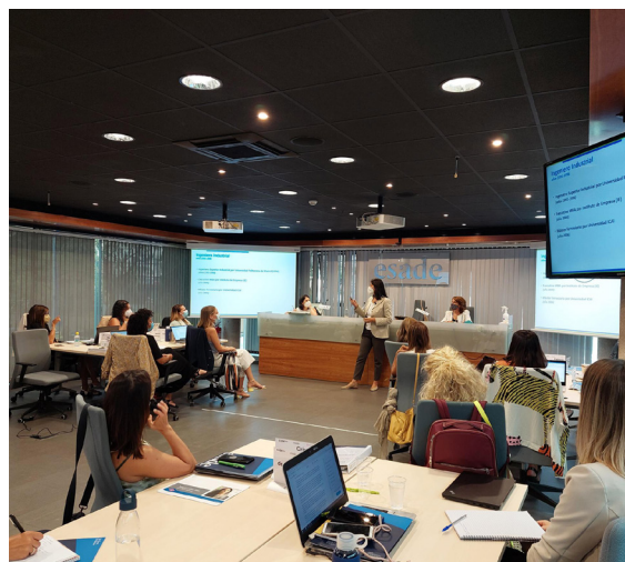
Sesión del Proyecto Progres

Este programa nace con la vocación de ayudar a las empresas a seguir impulsando la sostenibilidad, llevar las estrategias