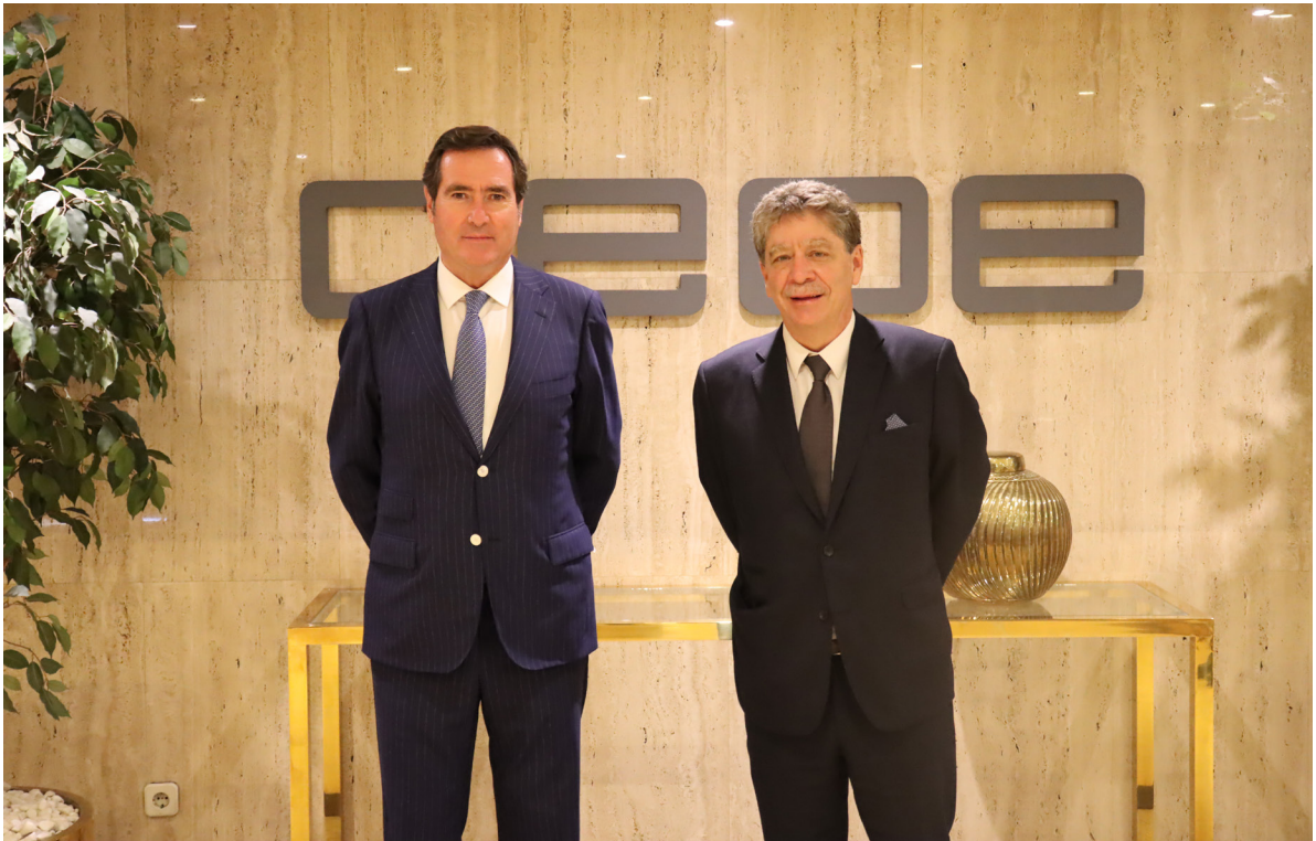
16/09/21 Visita del presidente de la Asociación Nacional de Empresarios de Colombia (ANDI), Bruce Mac Master