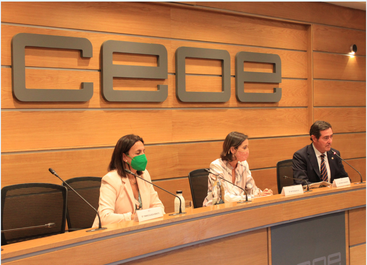
12/07/21 Intervención de la ministra de Industria, Comercio y Turismo, Reyes Maroto, en el Consejo de Turismo de CEOE