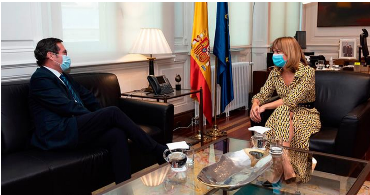
21/07/21 La ministra de Educación y Formación Profesional, Pilar Alegre, se reúne con el presidente de CEOE, Antonio Garamendi

También ha sido objeto de dedicación por parte del Departamento el desarrollo normativo de la (LOMLOE) Ley Orgánica 3/2020, por la que se modifica la Ley Orgánica 2/2006, de Educación , cuya aplicación está caracterizada por la existencia de importantes dificultades que precisamente se derivan de una ausencia relevante de consenso en su configuración y tramitación.