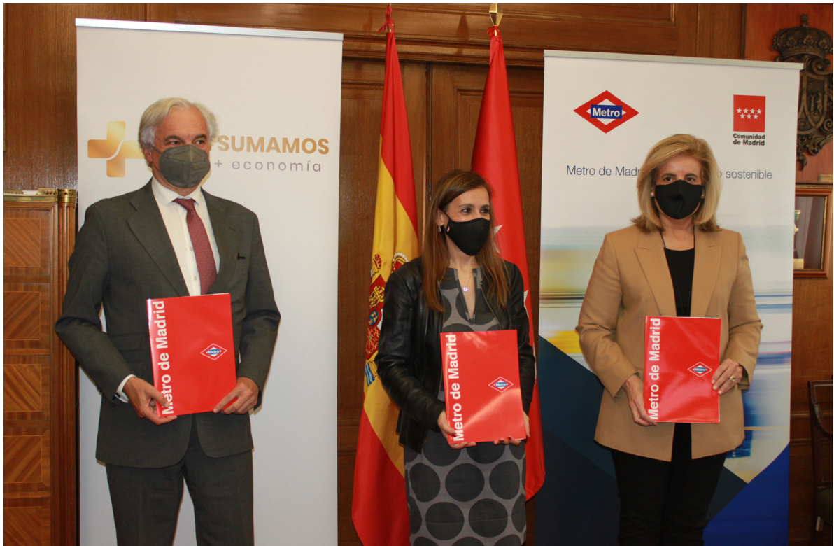
14/04/21 Adhesión de la empresa Metro de Madrid al Plan Sumamos de Fundación CEOE

A lo largo de 2021, en el marco de esta nueva estrategia, destacamos algunos de los más de 20 proyectos en marcha, divididos en proyectos propios y en alianzas estratégicas para el desarrollo de otros conjuntos.