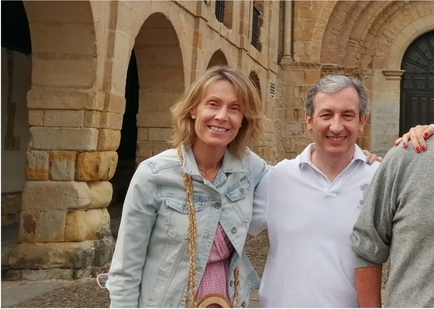
13/04/2021 Parte del equipo de CEOE realizando el Camino de Santiago

los trabajadores, y se han llevado a cabo los procesos de selección necesarios para cubrir las vacantes de profesionales que la organización demandaba, con un procedimiento de acompañamiento a las nuevas incorporaciones para asegurar la completa integración de los nuevos empleados.