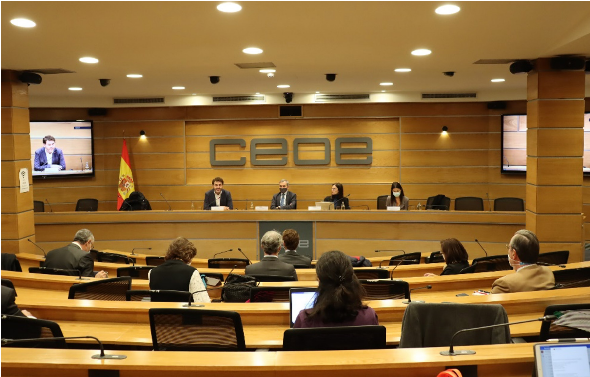
16/11/21 Reunión híbrida de la Comisión de UE de CEOE con la participación del eurodiputado Jonás Fernández, coordinador de grupo en la Comisión parlamentaria de Asuntos Económicos y Monetarios

con la Comisión Europea, eurodiputados españoles y la Secretaría de Estado para la UE. Las seis reuniones mantenidas en 2021, en formato híbrido o virtual, versaron sobre cómo reforzar el mercado interior para asentar la recuperación pospandemia (16/02), la implementación del Plan Europeo de Recuperación y el Marco Financiero Plurianual (20/04), las claves de la nueva estrategia industrial europea (08/06), las prioridades de la presidencia eslovena del Consejo y los trabajos en curso claves en BusinessEurope y en el CESE (Comité Económico y Social Europeo) (06/07), las iniciativas en materia de información no financiera y diligencia debida (16/11), o las prioridades en el ámbito económico y financiero en el Parlamento Europeo (16/11).