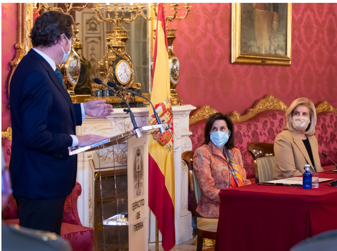
04/03/21 Firma del convenio entre la Fundación Museo del Ejército y la Fundación CEOE, con la presencia de la ministra de Defensa, Margarita Robles