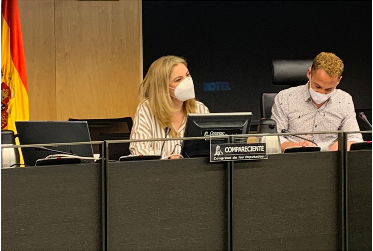
23/03/21 Comparecencia de la directora de Comunicación en la Comisión Mixta para la Coordinación y Seguimiento de la Estrategia Española para alcanzar los Objetivos de Desarrollo Sostenible (ODS) del Congreso de los Diputados