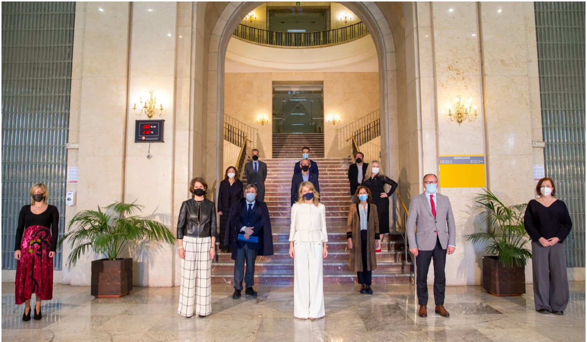
18/03/21 Firma de adhesión al proyecto Digitalízate de Fundae

empresas, jurado de los premios, etc., colaborando en la captación de nuevos socios del ámbito empresarial.