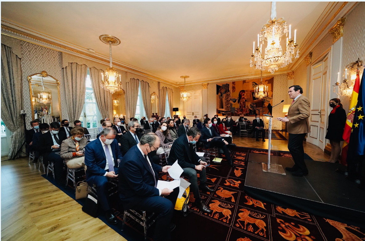
02/12/21 El presidente de CEOE en el II Foro Económico España-Francia