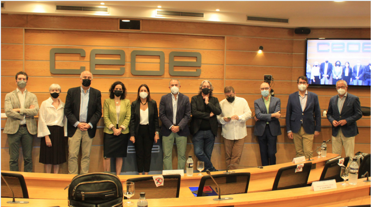
09/07/21 Jornadas sobre Cultura, Empresa y Territorio