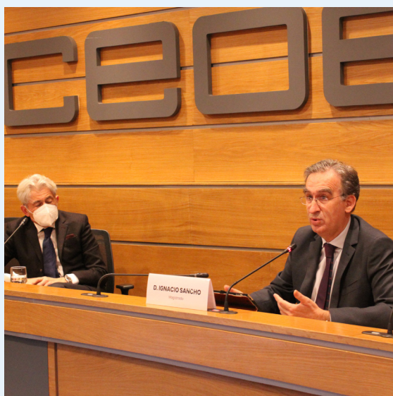
13/04/21 Visita del magistrado Ignacio Sancho Gargallo a la Comisión Legal de CEOE