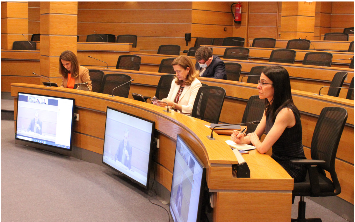
08/06/21 Jornada Claves de la nueva etapa industrial europea