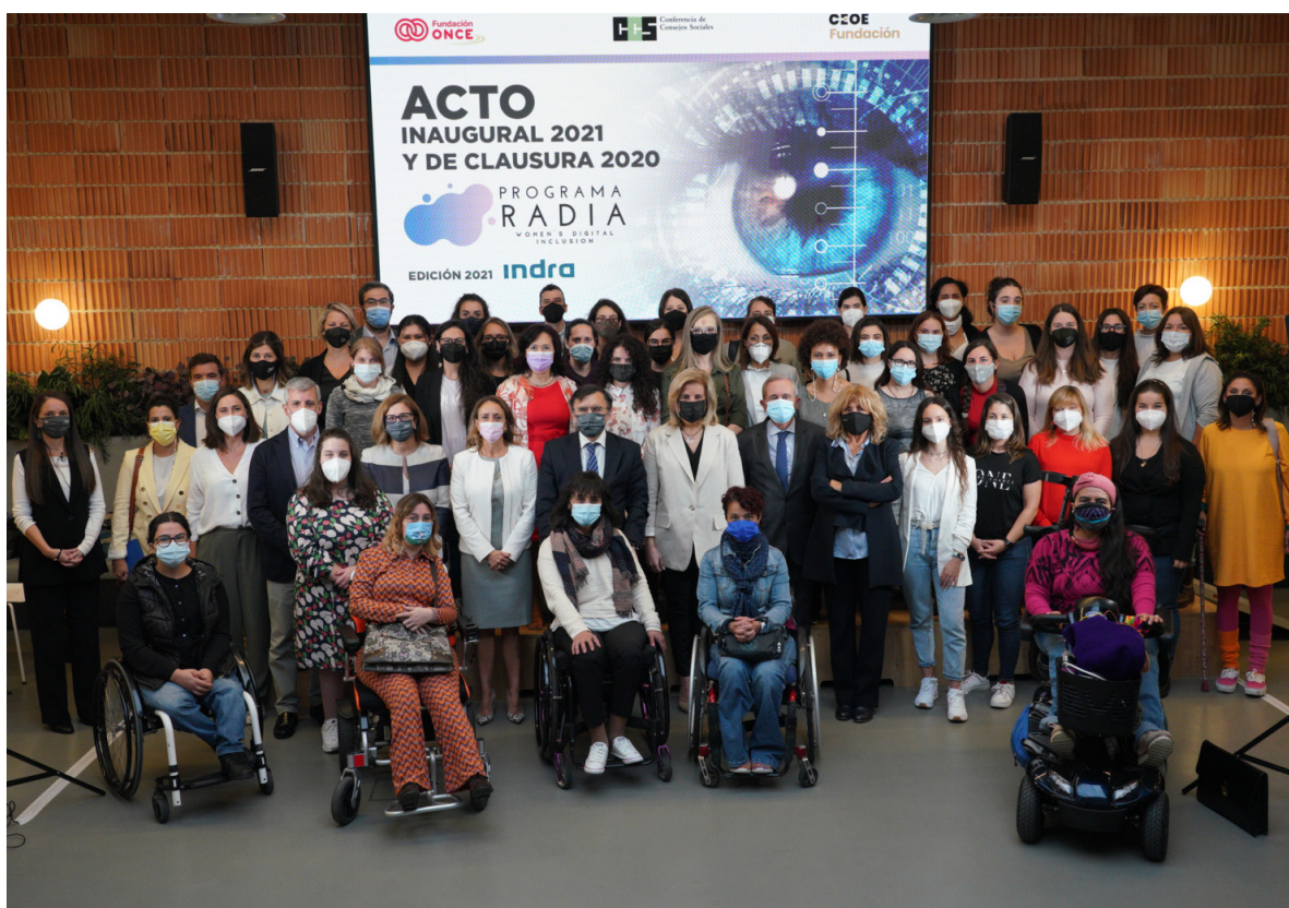
06/10/21 Inauguración del programa Radia 2021