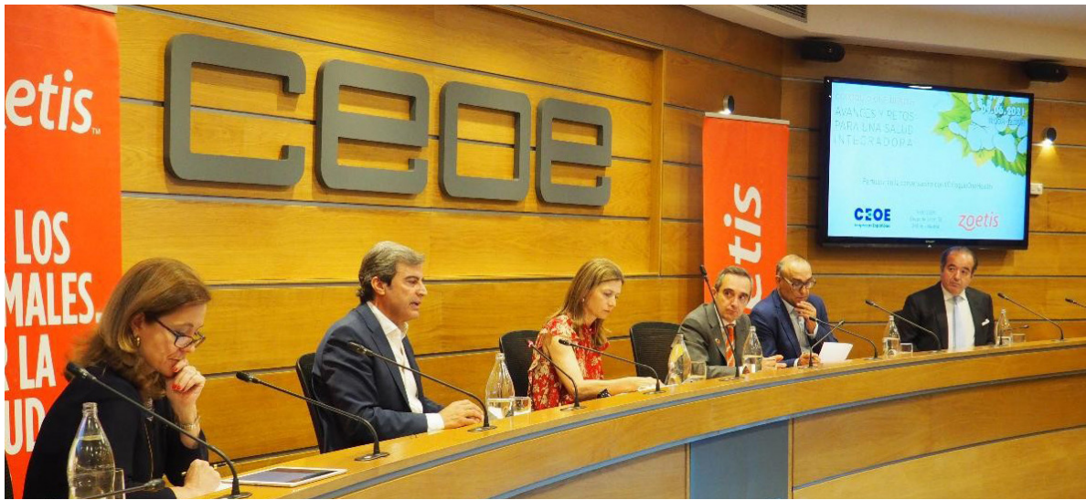
08/06/21 Jornada Claves de la nueva etapa industrial europea