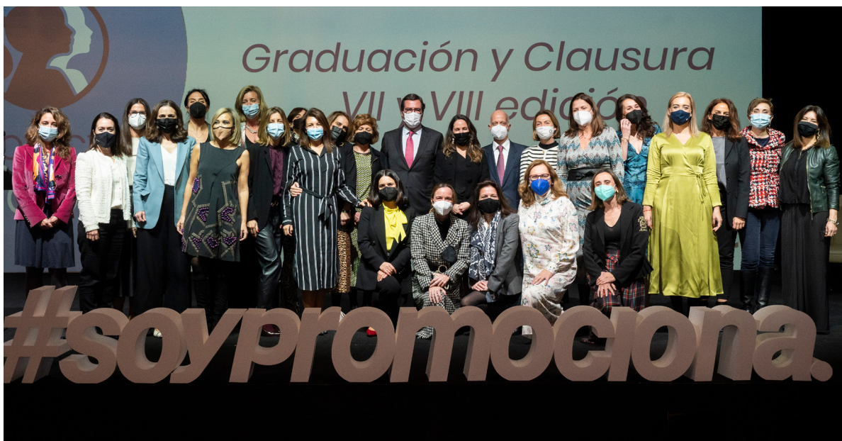
15/12/21 Graduación y clausura de la VII y VIII Edición del Proyecto Promociona

El dato se ha convertido en la materia prima de la transformación digital , su