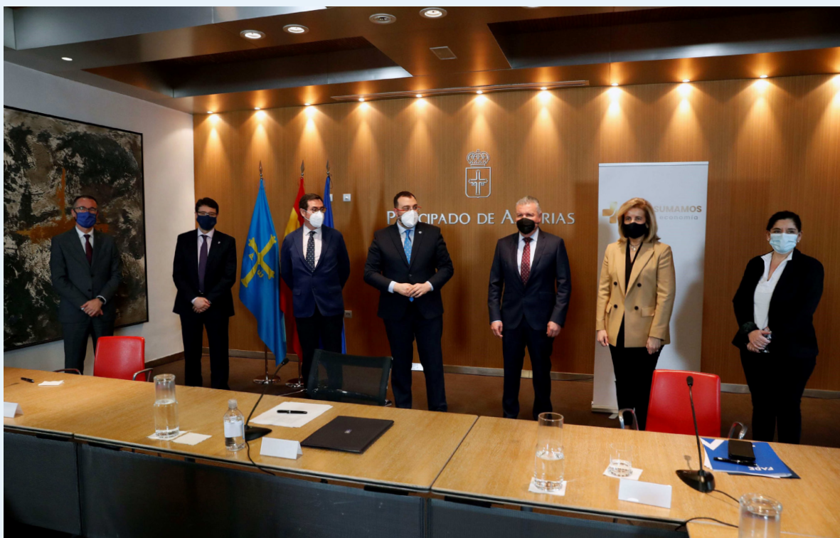
11/03/21 Adhesión al Plan Sumamos del Principado de Asturias