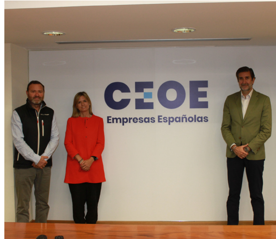
21/05/21 Visita a CEOE de la organización AFYDAD

'Transformación Digital: Playbook' 24/11/2021