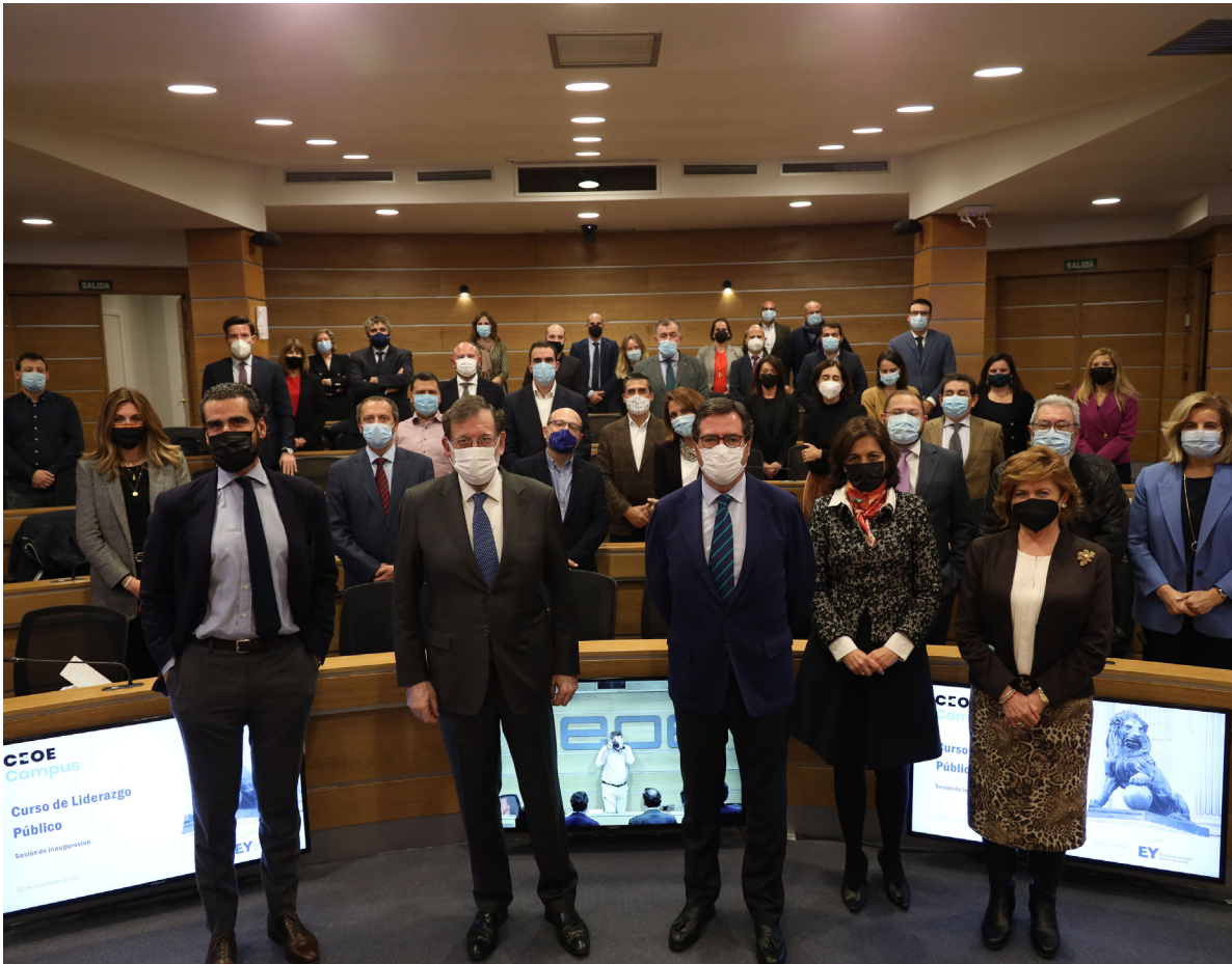
23/11/21 Presentación del Curso de Liderazgo Público de CEOE Campus

con ESADE, como partner académico, y con el patrocinio de Gilead Sciences.