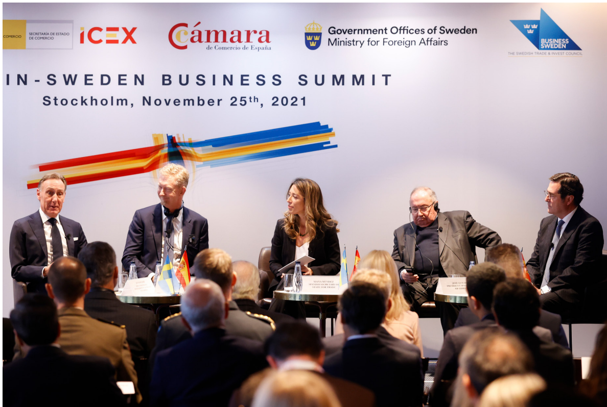
25/11/21 Encuentro empresarial España-Suecia