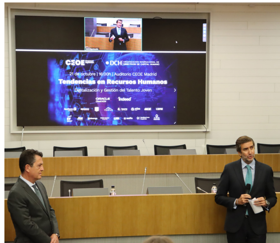
21/10/21 Encuentro DCH (Organización Internacional de Directivos de Capital Humano) y CEOE

'La Nueva Movilidad: Circular, Transversal y Sostenible'